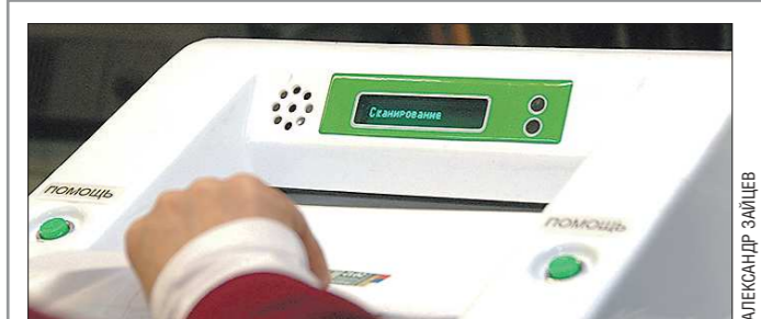
Ранее в регионе использовалось 732 комплекса. Теперь осталось 382

Подготовлено в соответствии с критериями, утвержденными приказом Департамента информационной политики Свердловской области от 09.01.2018 №1