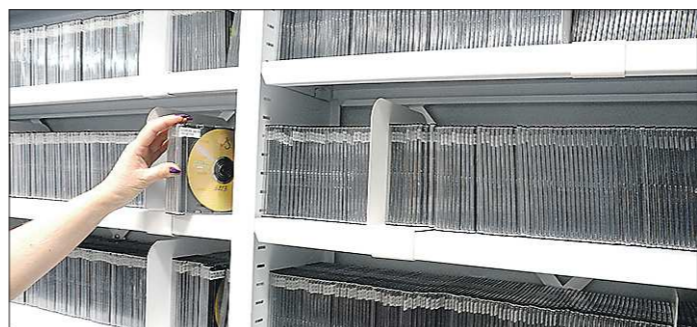
Теперь в областной библиотеке для слепых появится ещё больше аудиокниг

Кубок наций по велоспорту на треке стал премирным Кубком мира, который проводится с 1993 года. Этап Кубка наций уже прошёл в Гонконге и запланирован в Колумбии. Санкт-Петербург принял спортсменов на велодроме