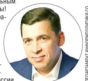
ДЕПАРТАМЕНТ ИНФОРМАЦИОННОЙ ПОЛИТИКИ

Губернатор Свердловской области Евгений КУЙВАШЕВ