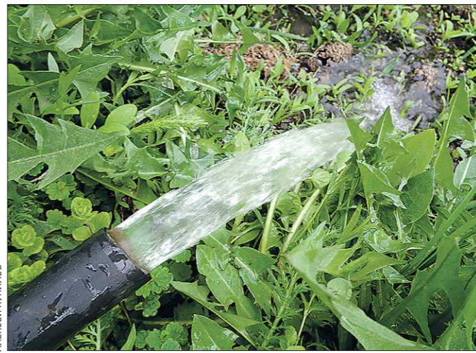
Полив из шланга – один из самых распространённых

К слову, поливать нужно и компостную кучу. Делать это необходимо утром, тогда в течение дня мокрый компост успеет хорошо прогреться, и запустится процесс активного разложения.