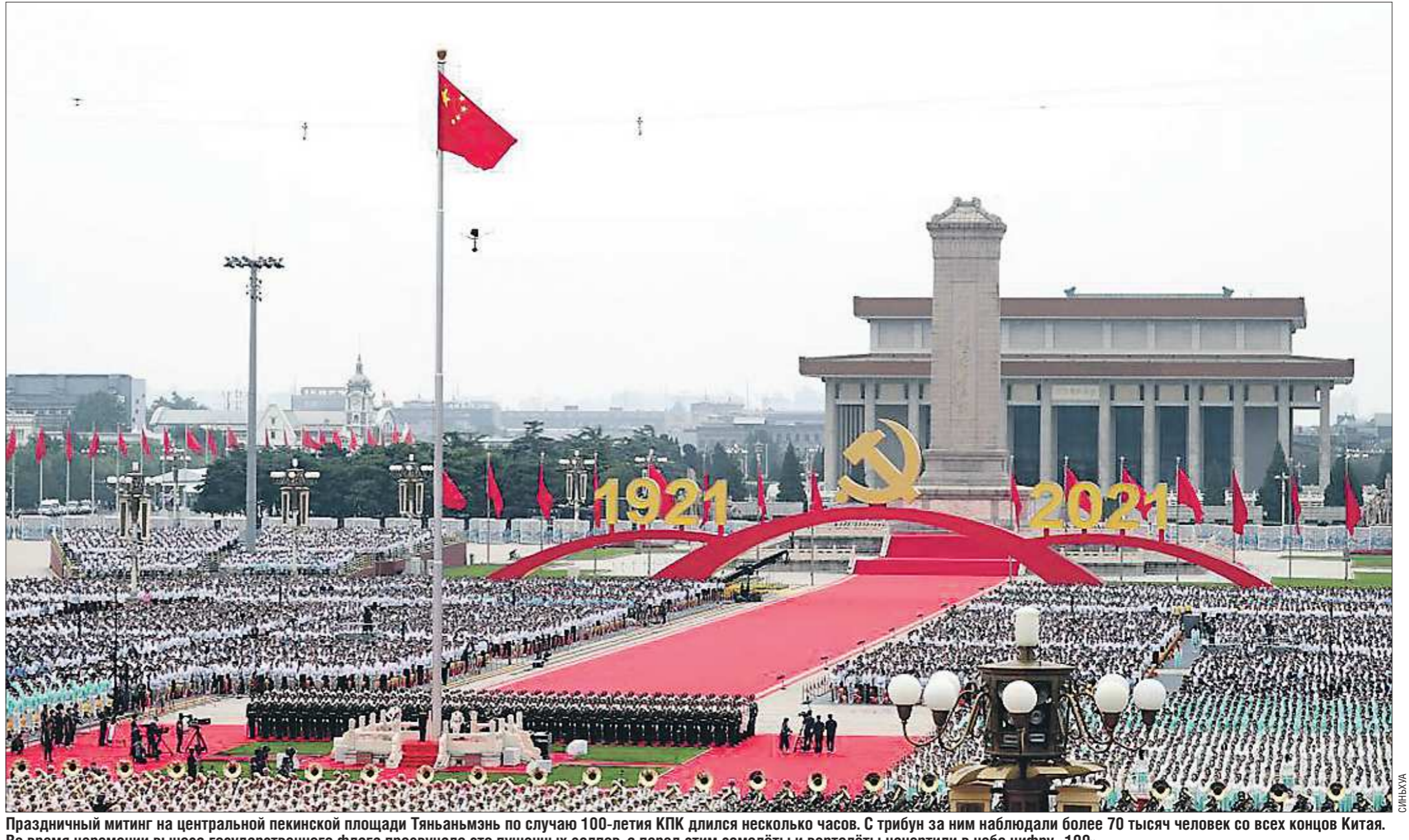
Праздничный митинг на центральной пекинской площади Тяньаньмэнь по случаю 100-летия КПК длился несколько часов. С трибун за ним наблюдали более 70 тысяч человек со всех концов Китая. Во время церемонии выноса государственного флага прозвучало сто пушечных залпов, а перед этим самолёты и вертолёты начертили в небе цифру «100»

Конечная самореализация партии сосредоточена на её первоначальной миссии, выражаемая современным китайским термином – «чу синь». Партия была основана с двумя главными целями в китайском контексте: социализм и национальное возрождение, чтобы избавить Китай от унижительной участи – страдать от иностранной агрессии и нищеты, что происходило с ним в современную эпоху, построить процветающее, сильное социалистическое общество и вернуть