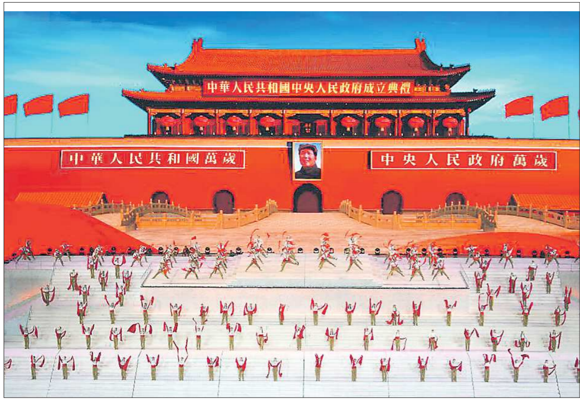
28 июня в Пекине на Национальном стадионе «Птичье гнездо» вместимостью 91 000 человек состоялось гала-представление «Великий путь», посвящённое 100-летию основания Компартии Китая

29 июня Си Цзиньпин впервые в истории вручил 29 членам КПК высшую партийную награду – орден Первого июля. Он представляет собой пятиконечную звезду с эмблемой Компартии Китая посередине – серпом и молотом. Орден крепится на ленту, состоящую из полосок красного, белого и золотого цветов. Его лауреатами стали 21 мужчина и восемь женщин, из которых трое человек были награждены посмертно. Одной из награждённых стала ровесница КПК – известная русист Цюй Дуи, живущая в Японии. Она была воспитанницей советского интернационального детдома в Иваново, а в октябре 1949-го именно Цюй Дуи озвучила по радио новость об образовании КНР на русском языке. Позже она открыла корпункт китайского информационного агентства «Синьхуа» в СССР