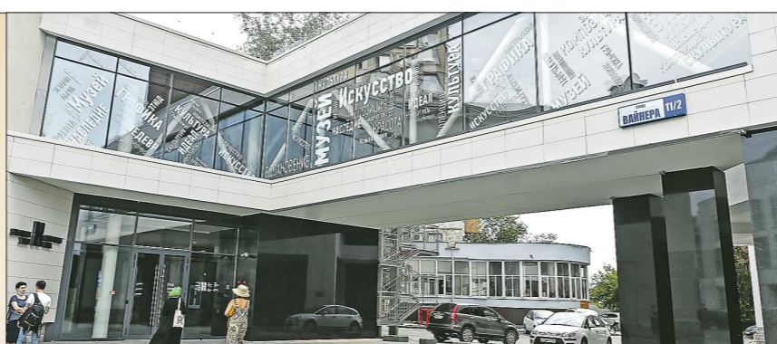
Центр «Эрмитаж-Урал» находится по адресу ул. Вайнера, 11