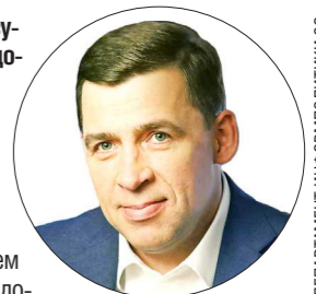
ДЕПАРТАМЕНТ ИНФОРМАЦИОННОЙ ПОЛИТИКИ

Губернатор Свердловской области Евгений КУЙВАСhev