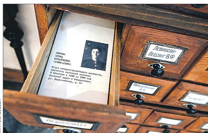
Картотека на сотрудников Эрмитажа, сохранивших уникальную коллекцию во время войны