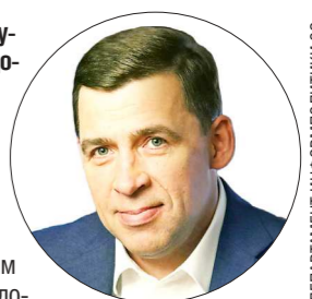
ДЕПАРТАМЕНТ ИНФОРМАЦИОННОЙ ПОЛИТИКИ

Губернатор Свердловской области Евгений Куйвашев