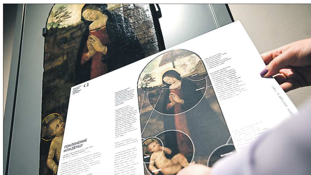
К картинам из постоянной экспозиции «Эрмитажа-Урала» подготовлены специальные аннотации, позволяющие подробно изучить работы

От момента заключения соглашения о создании центра «Эрмитаж-Урал» до финальной точки прошло семь непростых лет. Отчасти новый центр можно считать филиалом Государственного Эрмитажа, но инициаторы этого масштабного проекта называют его спутником, поскольку только сотрудничество с «большим братом» в «Эрмитаже-Урале» не ограничатся. Теперь это без преувеличения лучшая выставочная площадка Екатеринбурга и региона с передовым реставрационно-хранительским корпусом, который открыл для музейщиков совсем другие возможности.