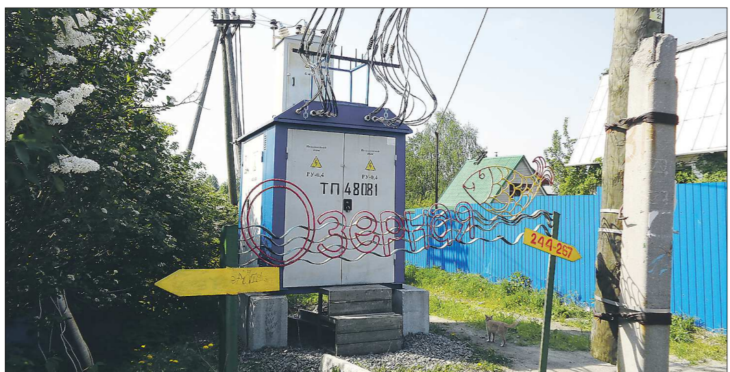
Модернизация электрических сетей влетает садоводам в копеечку