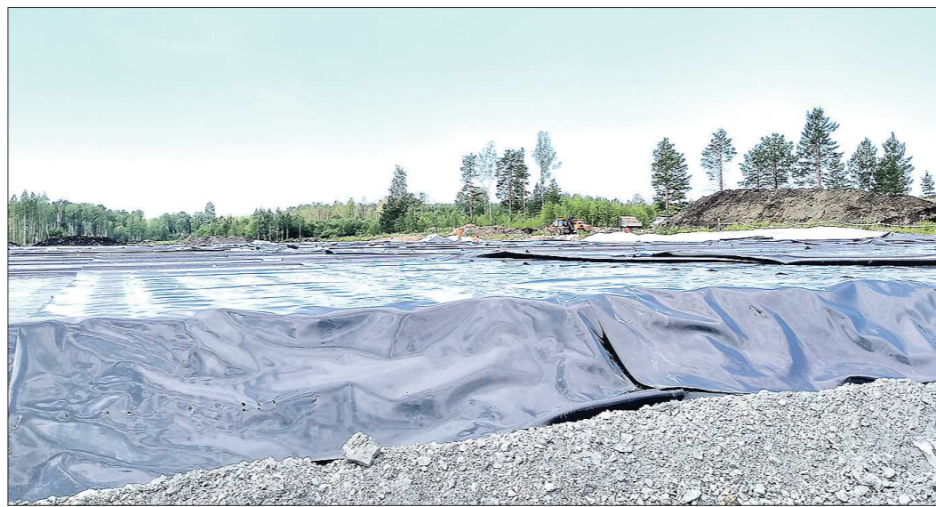
Геотекстиль помешает влаге просочиться в почву

В Горноуральском городском округе в рамках нацпроекта «Экология» начали готовиться к очистке от донных отложений ложа Черноисточинского пруда.