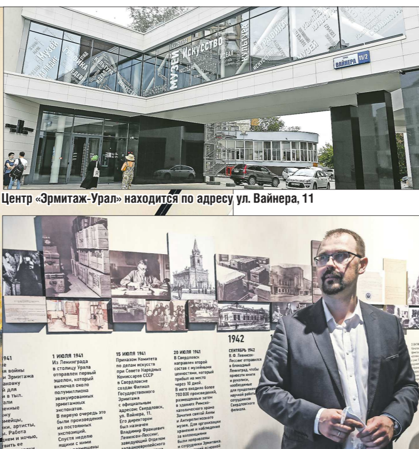
Центр «Эрмитаж-Урал» находится по адресу ул. Вайнера, 11

Сегодня свои двери для посетителей открывает долгожданный культурно-просветительский центр «Эрмитаж-Урал». От момента заключения соглашения о создании центра до финальной точки прошло семь непростых лет. Отчасти новый центр можно считать филиалом Государственного Эрмитажа, хотя инициаторы этого масштабного проекта называют его спутником. Теперь это без преувеличения лучшая выставочная площадка региона с передовым реставрационно-хранительским корпусом, который дал музейщикам новые возможности. На первой выставке «От романтизма к импрессионизму» зрители увидят работы Ван Гога, Гогена, Моне, Сезанна, Родена и других известных на весь мир художников