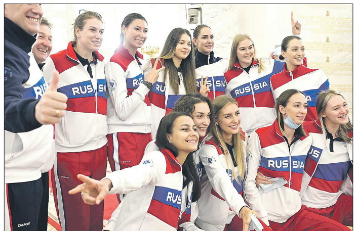
Российские волейболистки в Кремле, где они встречались с президентом страны