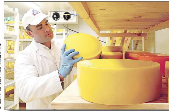
Общая гордость завода — сыры: их выпускают 14 видов

— В нашей линейке четыре группы сыров. Мягкие — «Рикотта», «Адиге» и «Фета», которые называются «Сельскими», чтобы не нарушать право территориальной принадлежно-