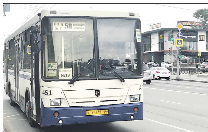
Один из немногих автобусов, вышедший в рейс с указанием и нового, и старого маршрутов. Такая практика пока применяется не везде

Подготовлено в соответствии с критериями, утвержденными приказом Департамента информационной политики Свердловской области от 09.01.2018 №1 «Об утверждении критериев отнесения информационных материалов, публикуемых государственными учреждениями Свердловской области, в отношении которых функции и полномочия уполномоченного уполномоченного Департамента информационной политики Свердловской области, к социально значимой информации».