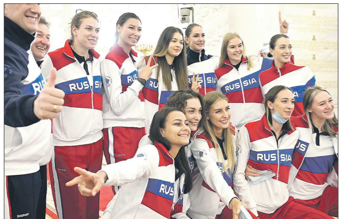
Российские волейболистки в Кремле, где они встречались с президентом страны