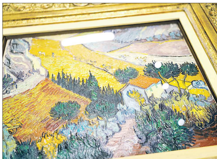
Работа Винсента Ван Гога «Пейзаж с домом и пахарем», написанная в 1889 году, впервые покинула стены Эрмитажа