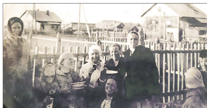
По данным переписи 1926 года, в Тыгише было 260 дворов