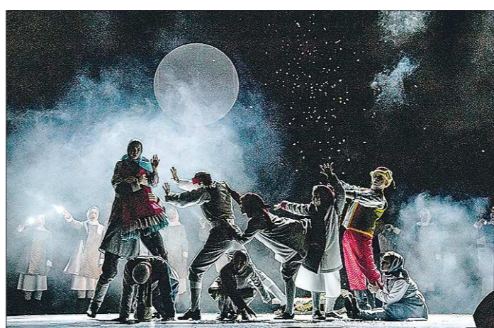
Тем, кто ещё не познакомился со спектаклем «Серебряное копытце», придётся дожидаться следующего сезона

Подготовлено в соответствии с критериями, утверждёнными приказом Департамента информационной политики Свердловской области от 09.01.2018 №1 – «Об утверждении критериев отнесения информационных материалов, публикуемых государственными учреждениями Свердловской области, в отношении которых функции и полномочия учредителя осуществляет Департамент информационной политики Свердловской области, к социально значимой информации».