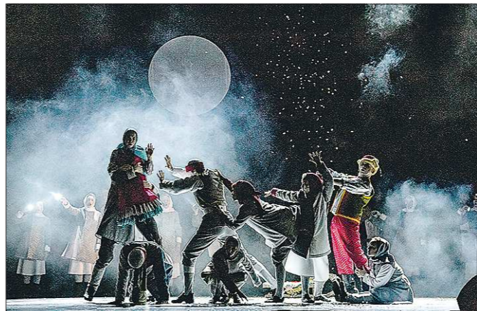
Тем, кто ещё не познакомился со спектаклем «Серебряное копытце», придётся дожидаться следующего сезона