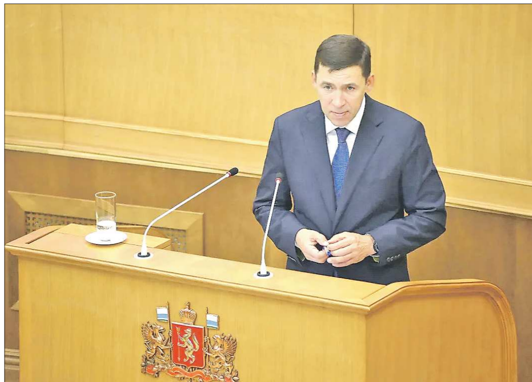
Во время выступления в Заксобрании Евгений Куйвашев подробно рассказал о трудностях, с которыми столкнулся Средний Урал в «ковидный» год

Для школьников Свердловской области реализованы возможности участия в профильных сменах Центра выявления и поддержки одарённых детей, обучения в центрах цифрового образования детей «IT-КУБ», технопарках «Квантори-