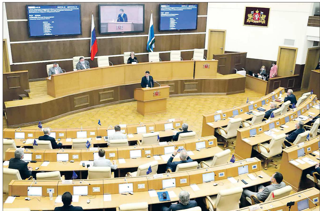
Губернатор Евгений Куйвашев 40 минут отчитывался перед Заксобранием, а потом ещё столько же отвечал на вопросы депутатов