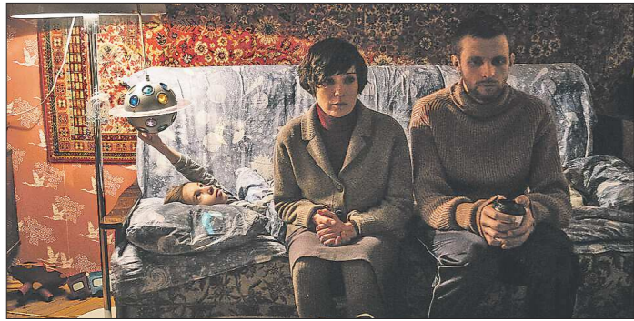
Семён Серзин и Чулпан Хаматова сыграли главных героев фильма