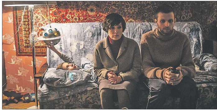
Семён Серзин и Чулпан Хаматова сыграли главных героев фильма