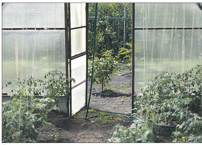
При непереветривании теплицы завязывание плодов и само плодоношение оттянутся на поздние сроки

соб борьбы с болезнями растений – следить за почвой. Надо заниматься почвой, тогда и бляшек на помидорах не будет. Заниматься – значит мульчировать, проливать раствором «Байкала», не увлекаться излишним поливом. А ведь у нас некоторые умудряются чуть ли не каждый день помидоры поливать. Конечно, при таком режиме полива появляется излишняя влажность, а с ней