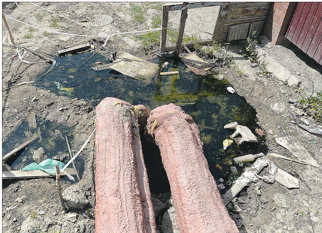
Вот так выглядит аварийный участок сети ГВС по улице Механизаторов в Позарихе