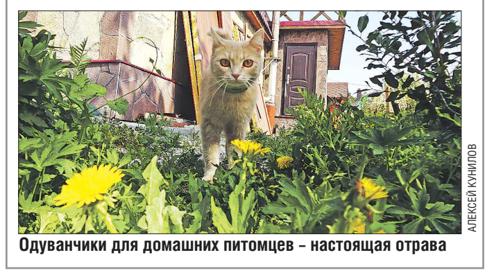
Одуванчики для домашних питомцев – настоящая отрав