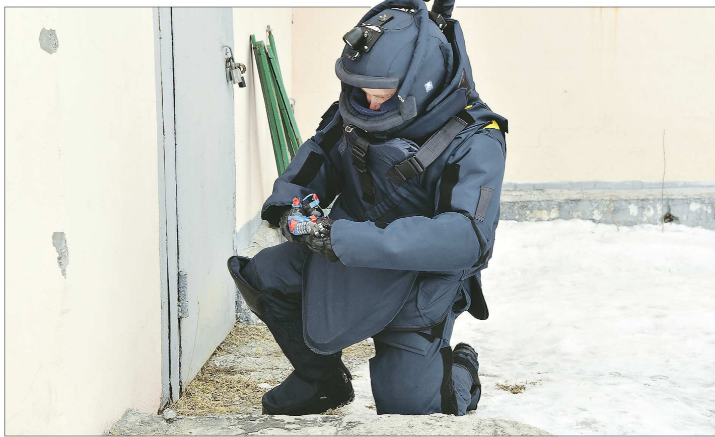
Накануне профессионального праздника - Дня войск национальной гвардии Российской Федерации - журналисты «Облгазеты» побывали у уральских росгвардейцев и познакомились с тем, как проходят их будни. На снимке - тренировка по обезвреживанию взрывного устройства. Современный взрывозащитный костюм, несмотря на громоздкость, позволяет сапёру свободно двигаться и надёжно защищает от осколков

Журналисты «ОГ» увидели изнутри жизнь войск правопорядка на Среднем Урале