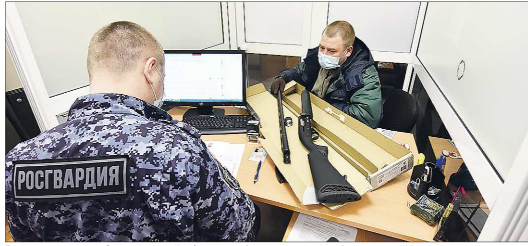
В прошлом году в Свердловской области зафиксировано 1 418 нарушений сроков регистрации и продления разрешений на хранение оружия