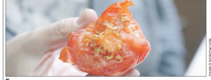
Если долго хранить томат в тепле, то он может стать теплицей для рассады собственных проростков