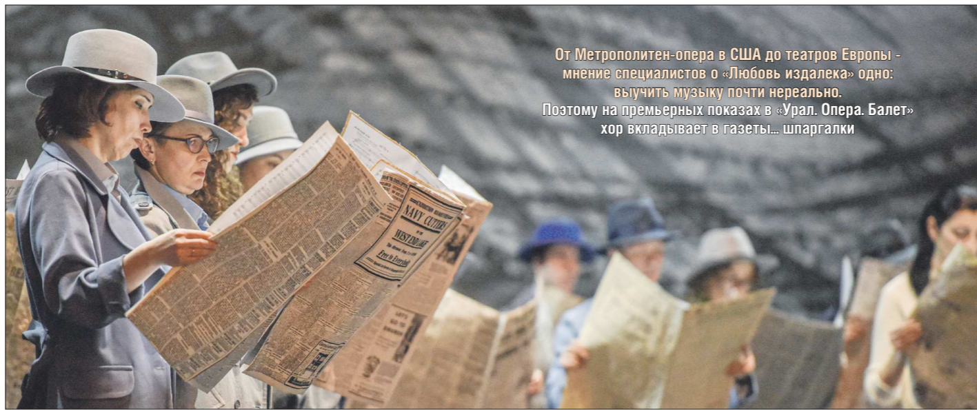
От Метрополитен-опера в США до театров Европы – мнение специалистов о «Любовь издалека» одно: выучить музыку почти нереально. Поэтому на премьерных показах в Урал. Опера. Балет» хор вкладывает в газеты... шаргалки

– Поскольку композитор «экзотический» для оперы, сказывается ли в музыке менталитет автора? Чего больше – Финляндии или Франции (раз сюжет основан на истории трубадура)?