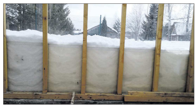
Через стекло теплицы высота снега действительно кажется большой

Многие садоводы и дачники отмечают, что в этом году на участках, как никогда ранее, скопилось много снега. Вдобавок сильно промёрзла земля — в овощных ямах от этого критически снизилась температура. Как эти факторы скажутся на сроках посевных работ и насыщении почвы влагой?