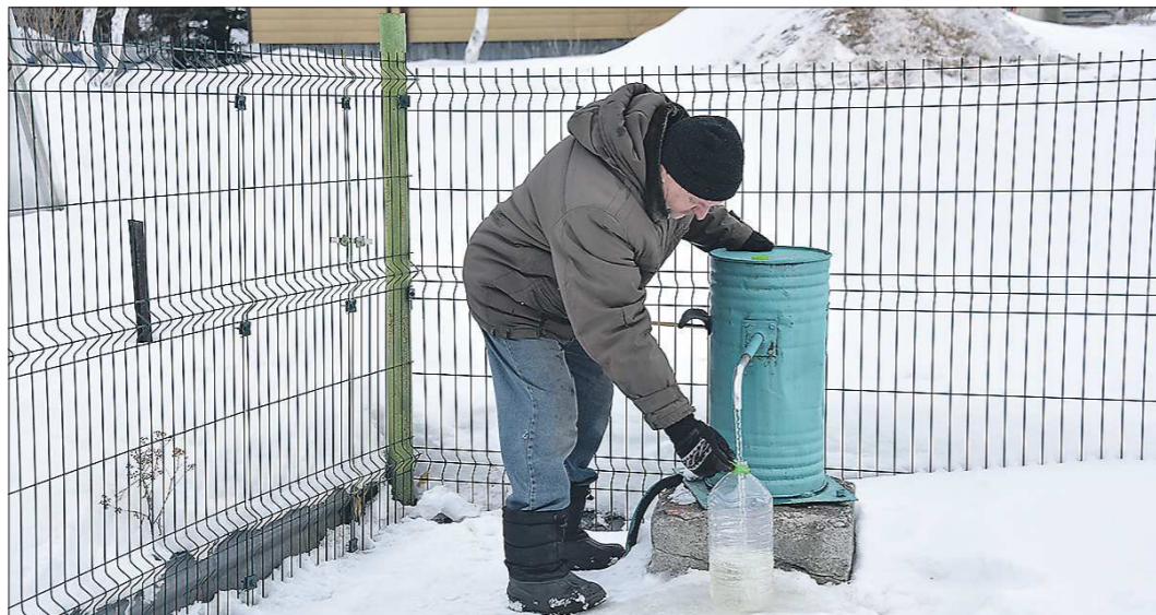
Общественная колонка в саду с питьевой водой здорово выручает тех, кто живёт здесь круглый год