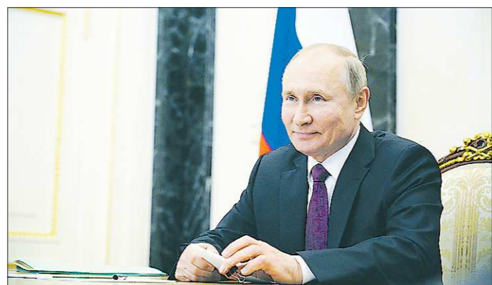
Владимир Путин пообещал, что после сделанной прививки будет расширять географию встреч, посетит и учреждения культуры

Участники встречи выступили с инициативой проведения в 2022 году Год народной культуры и нематериального культурного наследия. Директор Белгородского государ-