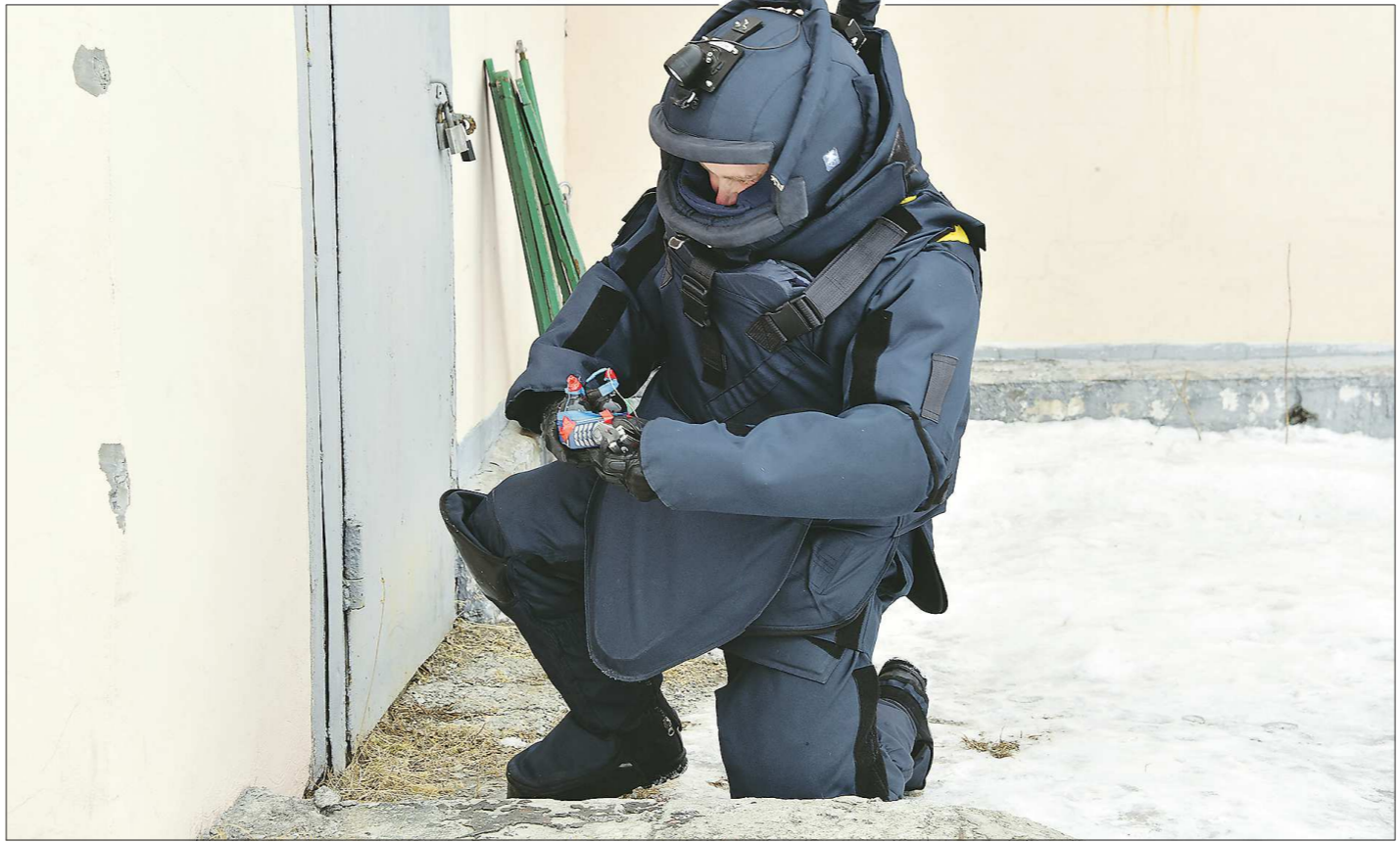
Накануне профессионального праздника - Дня войск национальной гвардии Российской Федерации - журналисты «Областа» побывали у уральских росгвардейцев и познакомились с тем, как проходят их будни. На снимке - тренировка по обезвреживанию взрывного устройства. Современный взрывозащитный костюм, несмотря на громоздкость, позволяет сапёру свободно двигаться и надёжно защищает от осколков

Журналисты «ОГ» увидели изнутри жизнь войск правопорядка на Среднем Урале