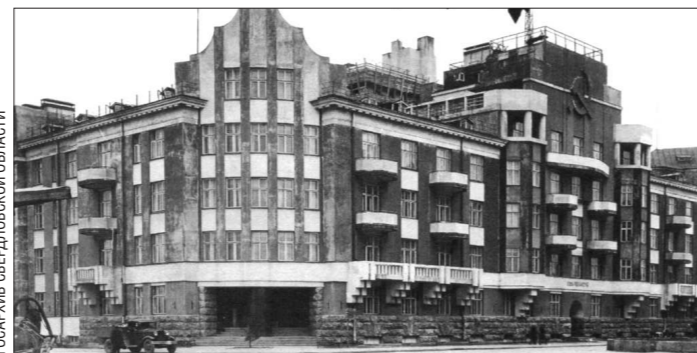
Вид на Дом чекиста с улицы Володарского, 1930-е годы