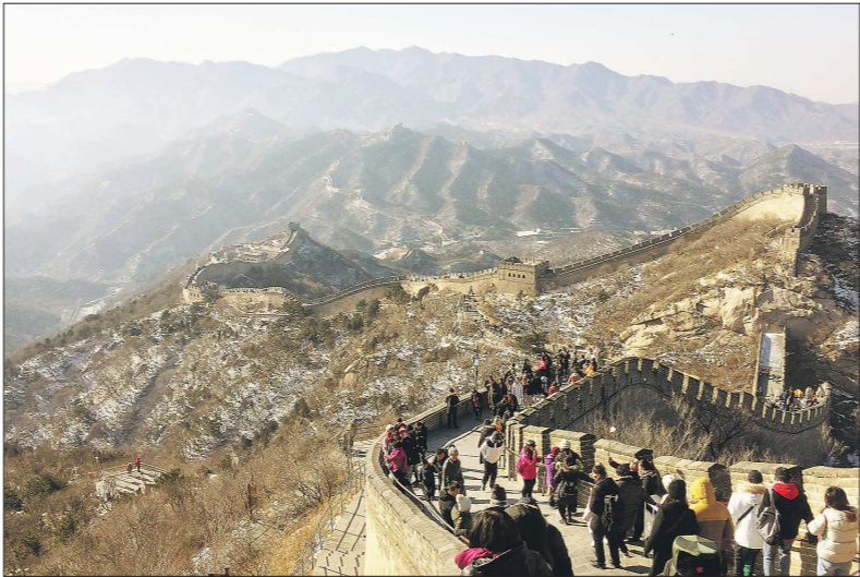
За 13-ю пятилетку Китай полностью искоренил крайнюю нищету в стране. Главная задача новой пятилетки — построение общества всеобщей зажиточности

Стоит отметить, что 14-я пятилетка, рассчитанная на 2021–2025 годы, — это важный промежуточный период, когда Китай победоносно выполнит задачи полного построения общества средней зажиточности.