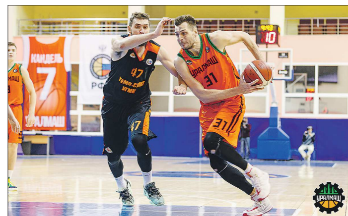
Если в полуфинале сойдётся «Уралмаш» и «Темп», то один из свердловских клубов гарантированно сыграет в золотой серии

Впрочем, география – это всё-таки важный, но второстепенный фактор. Главное – в ка-