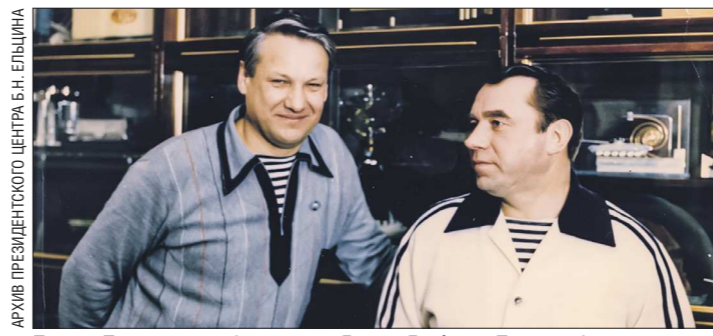
Борис Ельцин на 50-летию у Якова Рябова. Горки-10, Московская область. Март 1978 года