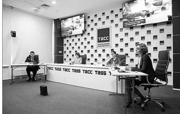
Вебинар о мерах налоговой поддержки, бизнес-неделя «Новые решения» (27 мая, г. Екатеринбург)

26 мая совместно с представителями Минисогосударства Свердловской области, Уральского ГУ Банка России и СОФПП обсуждены реализуемые меры финансовой и имущественной поддержки субъектов предпринимательской деятельности.