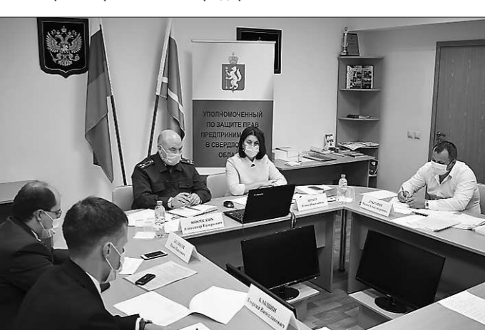
Совместный прием с главой и прокурором Первоуральска (21 мая, 19 октября, 21 декабря – приняты 27 предпринимателей)

Проводились совместные приемы с прокурором Первоуральска (21 мая, 19 октября, 21 декабря – приняты 27 предпринимателей)