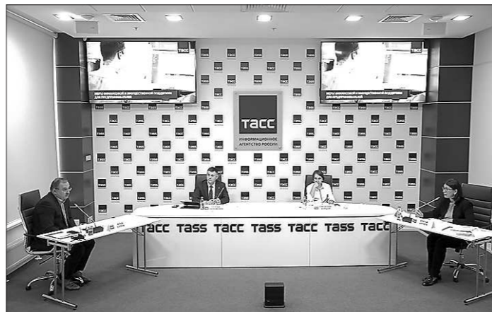
Вебинар об обязательных требованиях по санэпидрежиму и проверках, бизнес-неделя «Новые решения» (28 мая, г. Екатеринбург)

- о налоговых мерах поддержки бизнеса и защите прав предпринимателей (30 апреля, совместно с Управлением ФНС России по Свердловской области); - о профилактике распространения новой коронавирусной инфекции в условиях продолжения предпринимательской деятельности (8 мая, совместно с Управлением Роспотребнадзора по Свердловской области); - о защите прав предпринимателей в период пандемии (15 мая). Количество просмотров прямых эфиров составило 1 787. В период с 22 по 29 мая 2020 года в рамках тематической недели «Новые решения», традиционно посвященной профессиональному празднику – Дню российского предпринимательства, в онлайн-формате Уполномоченным были проведены 5 консультационных и обучающих мероприятий, участниками которых стали 10 приглашенных спикеров и 17 387 слушателей. Организовано участие Уполномоченного в двух телетрансляциях на телеканале ОТВ, в онлайн-брифинге с ответами на вопросы журналистов о состоянии бизнеса и защите его прав в условиях противодействия распространению новой коронавирусной инфекции.