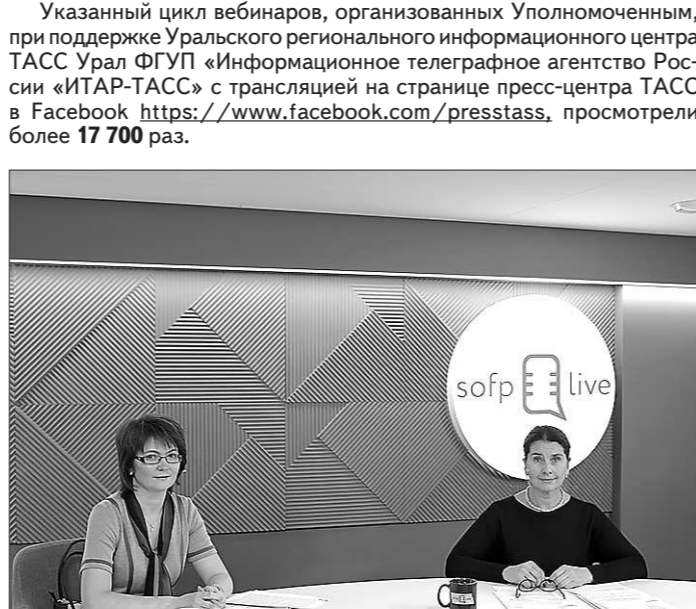
Вебинар о самозанятых и мерах их государственной поддержки (11 сентября, г. Екатеринбург)

28 мая совместно с представителями Управления Роспотребнадзора по Свердловской области и Государственной инспекции труда в Свердловской области (далее – Гострудинспекция в Свердловской области) обсуждены вопросы обязательных требований по санэпидрежиму, порядка их исполнения и проверках, а также иные вопросы, связанные с предпринимательской деятельностью в текущих условиях. Указанный цикл вебинаров, организованных Уполномоченным, при поддержке Уральского регионального информационного центра ТАСС Урал ФГУП «Информационное телеграфное агентство России «ИТАР-ТАСС» с трансляцией на странице пресс-центра ТАСС в Facebook https://www.facebook.com/pressstas , просмотрели более 17 700 раз.