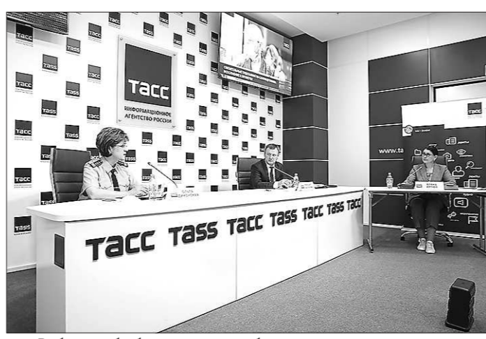
Вебинар о возможных дополнительных мерах поддержки бизнеса в рамках полномочий городского округа к проекту постановления администрации округа «Об утверждении мер имущественной поддержки юридических лицам и индивидуальным предпринимателям, пострадавшим в условиях ухудшения ситуации в результате распространения новой коронавирусной инфекции (2019-nCoV) на территории Камышловского городского округа»

27 мая – совместно с представителями Управления ФНС России по Свердловской области и Министерства экономики и территориального развития Свердловской области обсуждены вопросы о мерах налоговой поддержки.