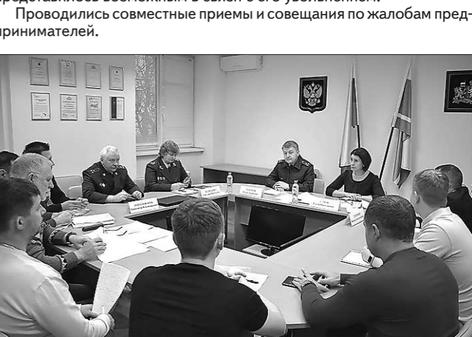
Совместный прием с прокуратурой Свердловской области (18 июня, г. Екатеринбург)

В частности, 15 января Уполномоченный совместно с заместителем прокурора Свердловской области, прокурором города Екатеринбурга и прокурором Кировского района города Екатеринбурга провели прием 9 хозяйствующих субъектов, жалующихся на необоснованные отказы органов полиции в возбуждении уголовного дела о мошенничестве, совершенном в отношении заявителей. Результатом приема стало возбуждение 23 января уголовного дела по части 5 статьи 159 Уголовного кодекса Российской Федерации органами полиции с учетом позиции прокурора города Екатеринбурга. Права потерпевших предпринимателей восстановлены. Совместные приемы с прокуратурой Свердловской области прошли также 3 марта, 18 июня и 11 ноября, в ходе которых были рассмотрены проблемы 16 предпринимателей.