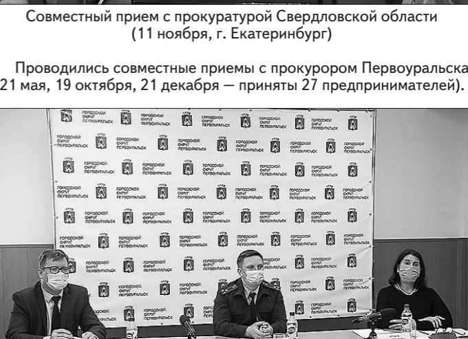
Совместный прием с прокуратурой Свердловской области (11 ноября, г. Екатеринбург)

Проводились совместные приемы с прокурором Первоуральска (21 мая, 19 октября, 21 декабря – приняты 27 предпринимателей)