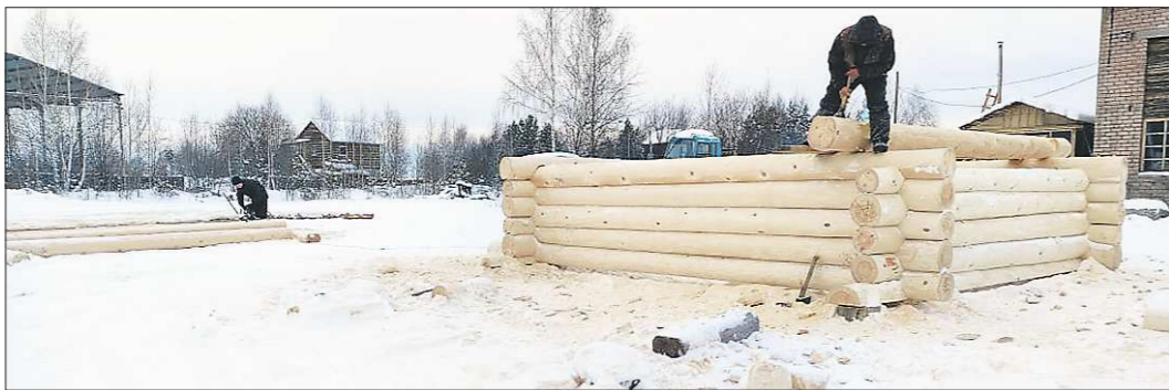
Очень важно для изготовления бани найти квалифицированную бригаду рубщиков или строительную организацию, где есть такие кадры

Строительство и покупка бани, которые обычно приходятся на начало весны, не менее ответственный процесс, чем возведение дома. На что надо обратить внимание тем, кто озабочился «банным вопросом»? Своим опытом по этой теме поделился наш эксперт – специалист по строительству деревянных рубленых домов и бань Василий Гайв.