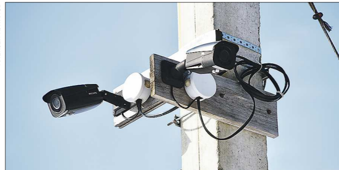
Видеокамеры круглосуточно следят за порядком на территории СНТ «Медная горка»

желании изображение можно увеличить, чтобы разглядеть детали. При этом сами камеры наблюдения в СНТ расположены высоко, так что для того, чтобы украсть их, надо очень сильно постараться.