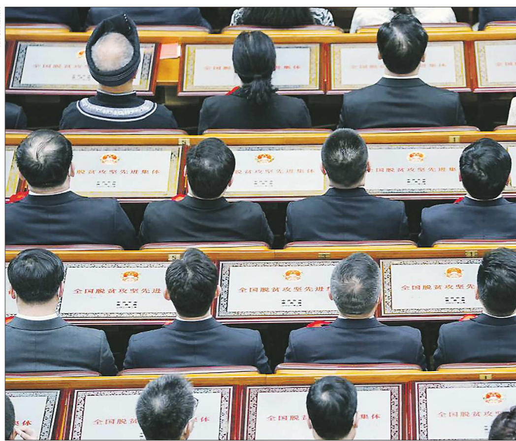
На фото — активные участники движения по борьбе с бедностью в КНР, которым вручили государственные награды за победу страны над крайней нищетой. Мероприятие прошло 25 февраля в Большом зале народных собраний в Пекине

По итогам третьего квартала прошлого года число бедных россиян составило 18,8 миллиона человек, или 12,7 процента населения страны. Об этом в середине недели рассказал министр труда и социальной защиты РФ Антон Котяков на заседании профильного комитета Госдумы. Ранее пресс-секретарь Президента России Дмитрий Песков сообщил журналистам, что работа по борьбе с бедностью ведётся на постоянной основе и будет продолжаться. Это заявление он сделал в ответ на новость о полной победе Китая в борьбе с крайней нищетой: за 40 лет в КНР из этого состояния вывели 770 миллионов человек. Чтобы этого добиться, Поднебесной пришлось перероентировать всю национальную экономику на повышение благосостояния народа. «Облгазета» подготовила специальную полосу, в которой наши корреспонденты попытались ответить на вопрос: как Китаю удалось справиться с этой общемировой проблемой