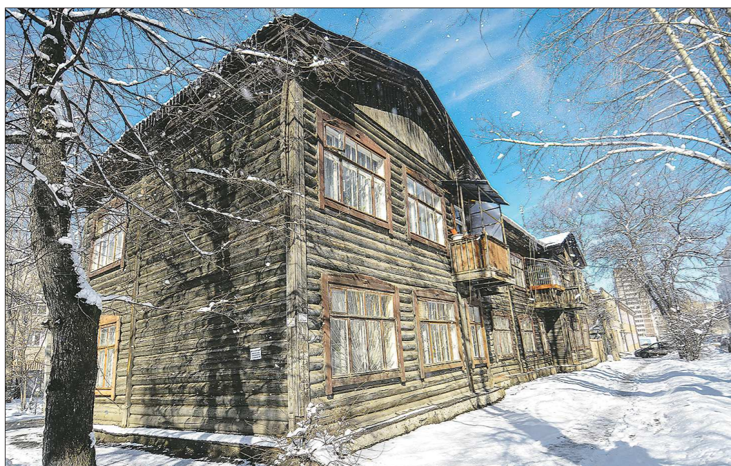
В первую очередь в программу реновации включают городские территории, где преобладает вот такая застройка

Подготовлено в соответствии с критериями, утвержденными приказом Департамента информационной политики Свердловской области от 09.01.2018 №1 «Об утверждении критериев отнесения информационных материалов, публикуемых государственными учреждениями Свердловской области, в отношении которых функции и полномочия учредителя осуществляет Департамент информационной политики Свердловской области, к социально значимой информации».