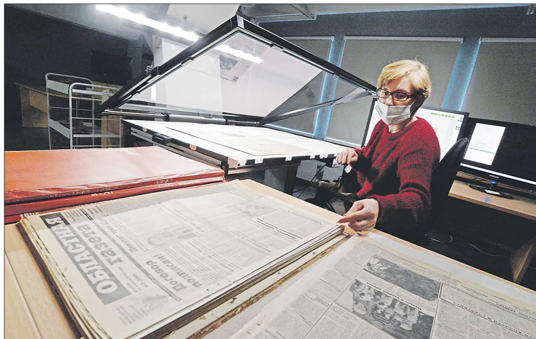
Работа по оцифровке «Областной газеты» в Белинке ведётся ежедневно