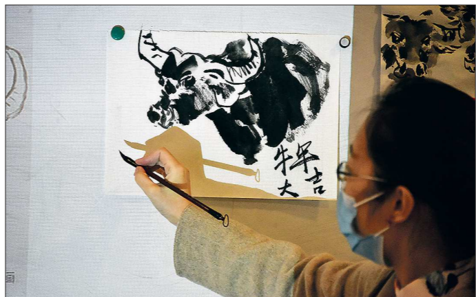
Несмотря на то что Год Быка в Китае начался лишь 12 февраля, в России его встретили ещё 31 декабря

Символичен и китайский обряд «связь поколений», когда на Новый год самые старшие представители семьи одаривают самых младших — внуков или правнуков — специальными красными конвертами хунбао, в которых лежат деньги.