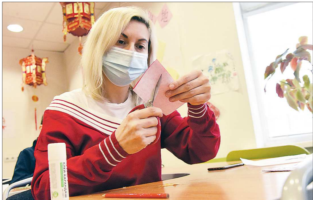
Одними из самых ярких украшений на китайский Новый год становятся фигурки из красной бумаги цзяньчжи

В Китае уже неделю отмечают самый главный праздник страны — Новый год по лунному календарю, который в 2021-м продлится с 12 по 26 февраля. Обычно, как и европейский Новый год, его принято встречать в семейном кругу: миллионы китайцев возвращаются в это время домой, чтобы провести каникулы вместе с родными.