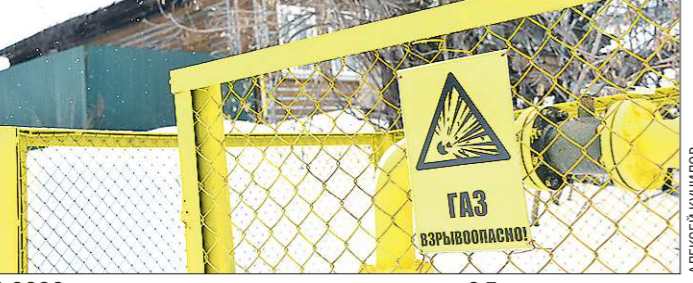
В 2020 году доступ к газу получили жители 2,5 тысячи домов