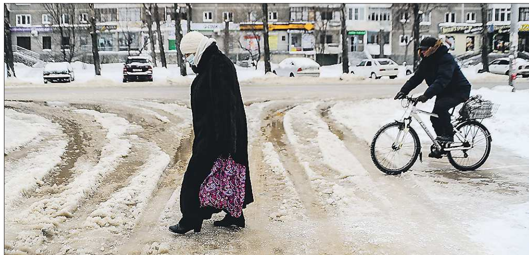
Резкая оттепель в начале февраля и сильные морозы на следующий день запомнятся уральцам

● 1704 год: «5 июля случилось такое явление, как в 1698 году, но мрак был менее и не долго продолжался. На другой день поутру восстала же-