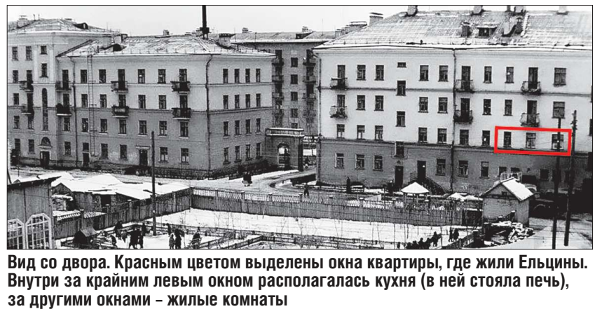
Вид со двора. Красным цветом выделены окна квартиры, где жили Ельцины. Внутри за крайним левым окном располагалась кухня (в ней стояла печь), за другими окнами – жилые комнаты