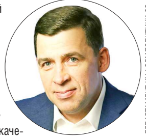
ДЕПАРТАМЕНТ ИНФОРМАЦИОННОГО ПОЛИТИКИ

Уважаемые жители Свердловской области! Сегодня свой профессиональный праздник отмечает дипломатическая служба России.