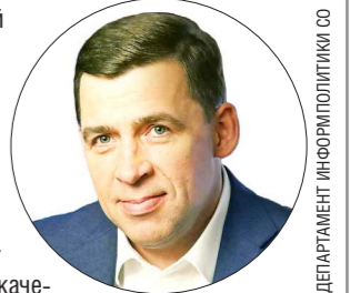
ДЕПАРТАМЕНТ ИНФОРМАЦИОННОЙ ПОЛИТИКИ

Высокопрофессиональная, ответственная работа российских дипломатов является залогом успешного решения целого комплекса задач по укреплению международного авторитета и престижа России, росту российской экономики, повышению качества жизни россиян.