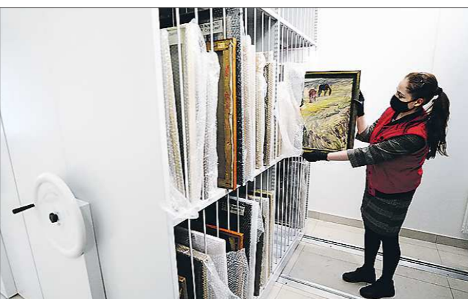
Часть экспонатов уже перевезли в новое хранилище. Но основная работа ещё впереди