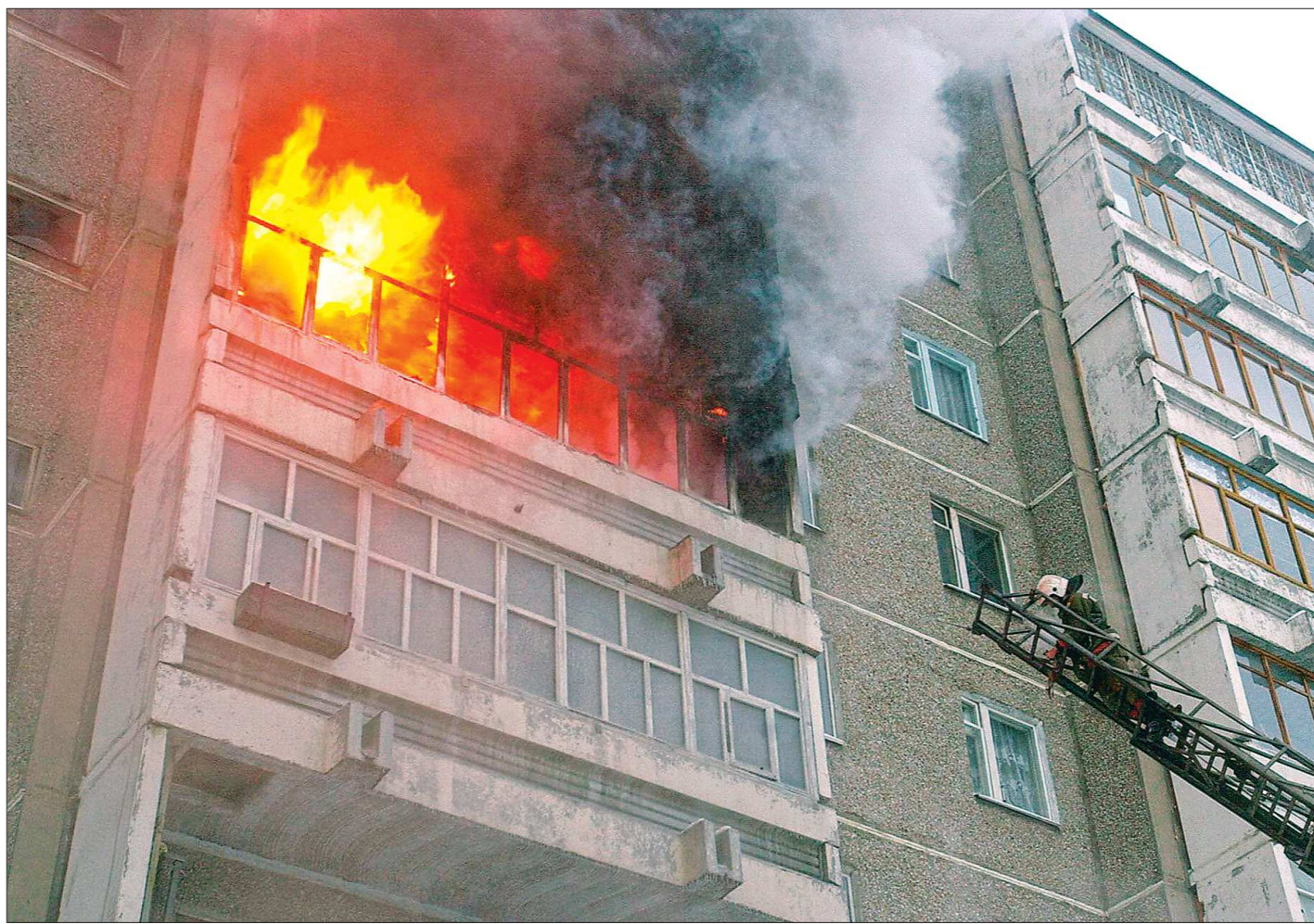
Почему даже при соблюдении всех мер пожарной безопасности в высотных домах жители всё-таки могут пострадать?