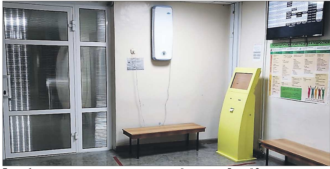
Перед объединением педиатрических участков в детской поликлинике Верхней Салды сделали ремонт

На этой неделе в Верхней Салде открылась обновлённая детская поликлиника – её филиал на улице Энгельса, 97 переехал на территорию местного медгородка с другой части города. Теперь маленькие пациенты будут получать медпомощь в одном месте. В здании старого филиала развернули отделение реабилитации для детей и подростков с ограниченными возможностями. Но, как выяснилось, не все горожане с радостью восприняли идею переноса детской поликлиники под одну крышу.