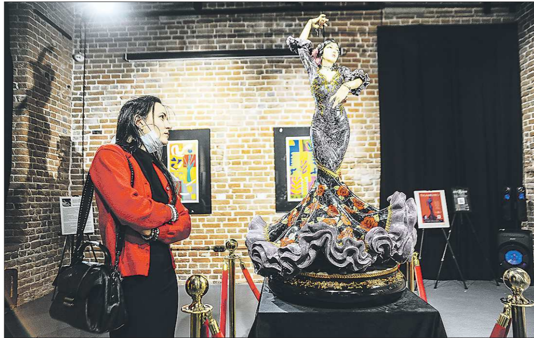
«Фламенко» и другие работы проекта «Танец страсти» хочет приобрести один из уральских меценатов, а затем передать его в парижский Лувр