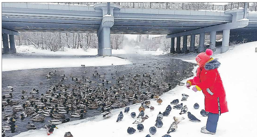
Даже в сильные морозы в нижнетагильском парке Народном находятся люди, сочувствующие зимующим уткам

Утки, наряду с голубями и воробьями, стали привычными городскими птицами. А ведь ещё лет десять назад встретить водоплавающих зимой считалось редким явлением. Постепенно тёплые промышленные стоки и принесённые горожанами крупы и хлеб сделали уток ленивыми. Количество зимующих птиц растёт с каждым годом. Если во время зимней переписи 2016 года в Екатеринбурге и его окрест-