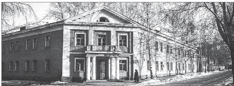
Так выглядел дом по ул. Кирова, 34 в 1995 году. На фотографии отчетливо видны колонны и балкон, которые теперь скрыты сайдингом