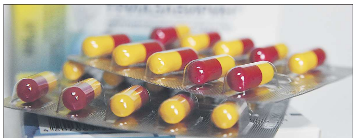
Сейчас проводятся исследования триазавирина, чтобы оценить его безопасность для детей при ОРВИ и гриппе