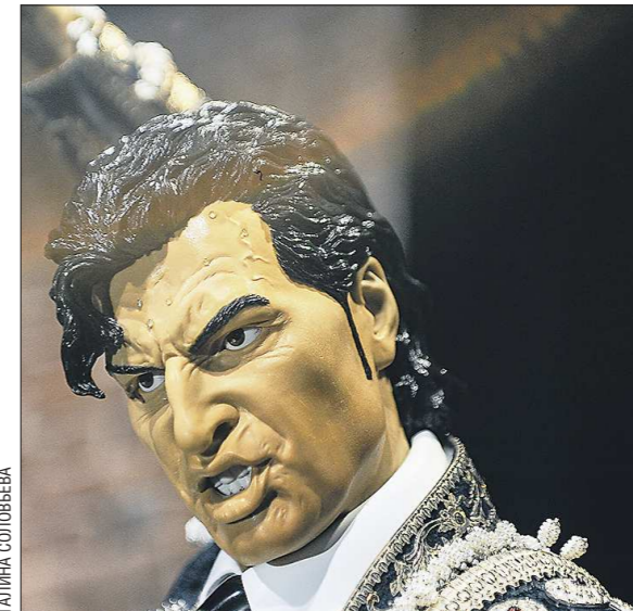
Увидев этого торедора, вы больше никогда не скажете безосмысленно: «Ну что ты как каменный!»

Чтобы работа, на которую будут затрачены годы, действи-