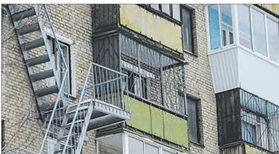
Пожарная лестница как бы есть, но зарешённые балконы не позволяют жильцам ею воспользоваться