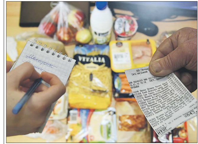
Отчётность по тратам заставляет попечителя аккуратнее распоряжаться средствами, которые получает опекаемый