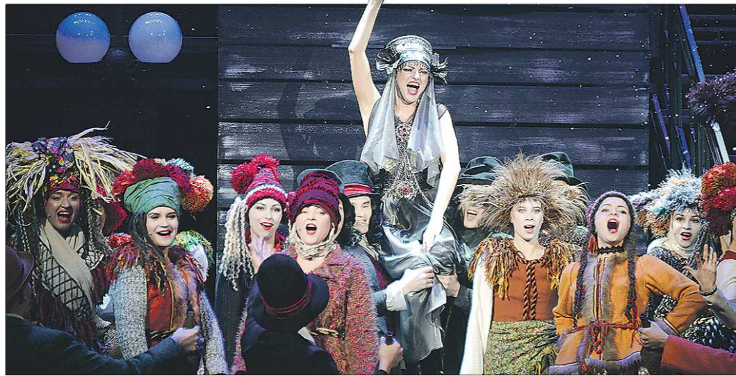
«Сильва» театра Музыкальной комедии номинирована и на «Золотую маску», и на премию губернатора Свердловской области