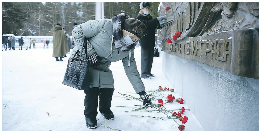
Одна из традиций месячника защитника Отечества — возложение в день окончания блокады цветов в памятной плите, посвящённой городу-герою Ленинграду, на мемориальном Ширококореческом кладбище Екатеринбурга

Круглый стол организовали в Уральском государственном экономическом университете, и неслучайно: молодые люди должны знать историю своей страны. В зале и с экрана к ним обращались те, кто пережил это страшное событие, — сами блокадники. Ленинград, второй по величине