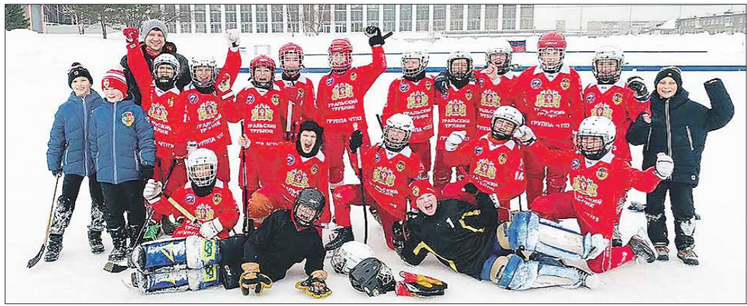
Юные первоуральцы готовятся покорять Москву

СТАТИ Впервые премии главы региона были вручены в 1996 году. Наша область стала первой, кто учредил подобные награды деятелям искусства. Премии присуждаются не более десяти по 200 тысяч рублей каждая. Как правило, лауреатов объявляют весной – в конце марта или апреле