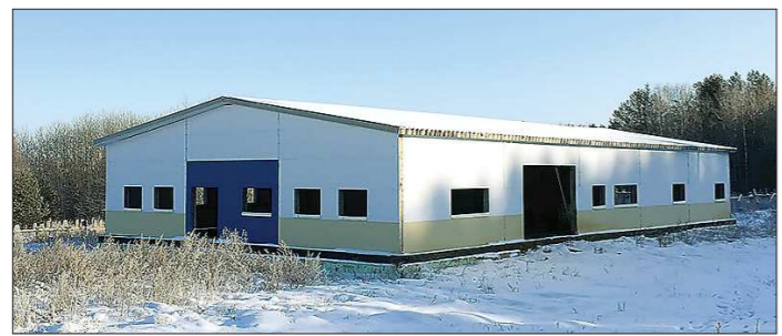
Коробку здания возвели сразу, а подготовить его к эксплуатации ещё только предстоит

В Нижней Салде определится подрядчик (третий по счёту), которому предстоит возвести лыжную базу на Зелёном Мысу. Строительство ведётся с 2018 года на средства, выделенные областью и муниципалитетом. Место выбрано неслучайно – здесь находили на лыжню многие поколения салдинцев.