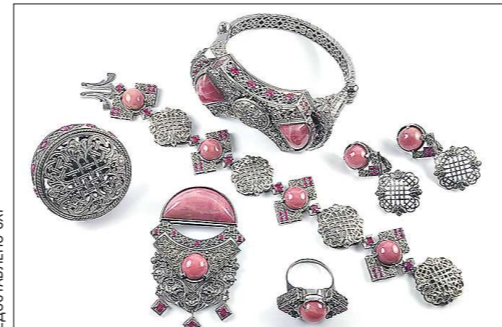
В гарнитур «Каслинский павильон» вошли подвес, серьги, два перстня и два браслета. Алексей Попов