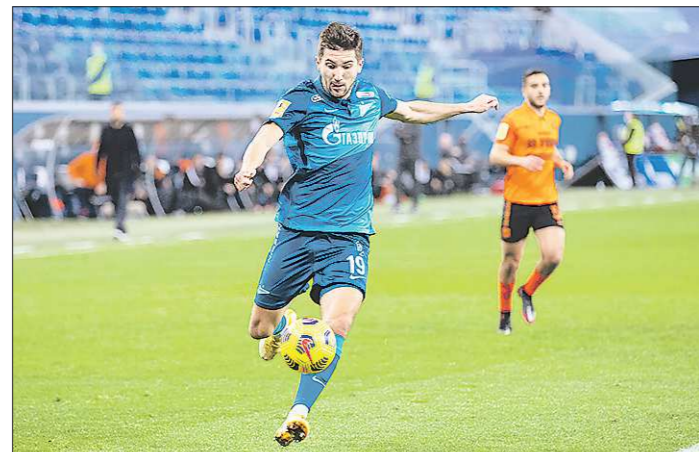
Клубы из России в Суперлиге не ждут. Разве что у «Зенита» есть шанс попасть в закрытое собрание «футбольных олигархов»

Международная федерация футбола (ФИФА) и шесть континентальных федераций (в том числе и европейская) выступили на минувшей неделе с совместным заявлением по поводу инициативы создания в Европе альтернативной футбольной Суперлиги.