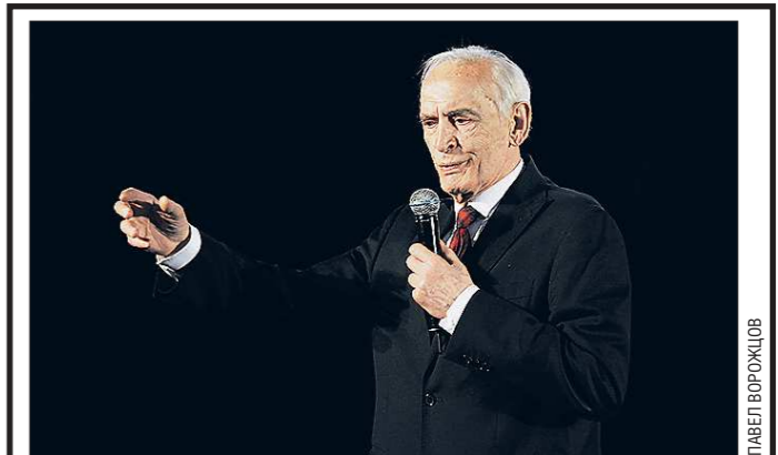
Василий Лановой в апреле 2017 года на сцене екатеринбургского Театра эстрады

Народный артист СССР Василий Лановой пополнил печальный список жертв коронавируса. 16 января ему исполнилось 87 лет. И это, наверное, не тот случай, когда можно случившееся списать на возраст, потому что актёр, который, казалось бы, уже сделал всё что мог, до последнего играл в спектаклях, мечтал о новых ролях на сцене Театра имени Евгения Вахтангова, которому он верой и правдой служил почти 65 лет.