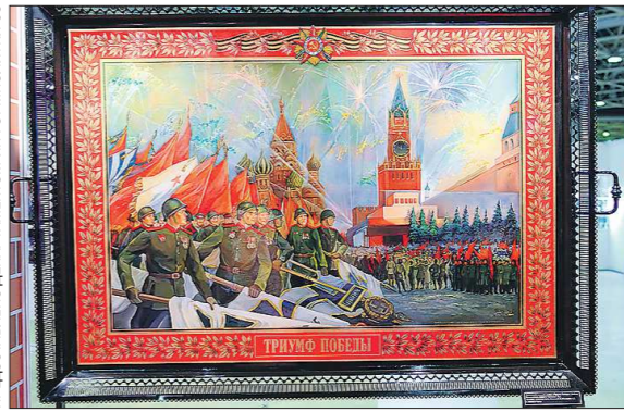
Поднос-панно «Триумф победы», коллектив авторов

нову брались привозные картины, которые продавались на Нижегородской и Ирбитской ярмарках. Это были сцены из барской жизни, пасторали, библейская тематика. В интервью «ОГ» ещё один участник группы Геннадий Бабин несколько лет назад говорил, что их главная задача как художников возродить именно сюжетный поднос, причём на больших кованных изделиях. Как видим, желание воплощается.