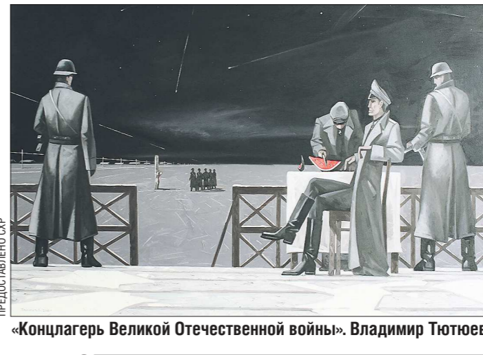
«Концлагерь Великой Отечественной войны». Владимир Тютюев