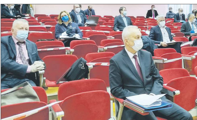
Маски, перчатки и социальная дистанция — депутаты выполняют все меры предосторожности

В то же время собственные доходы муниципалитета сокращаются почти на 60 миллионов рублей. Снижены поступления от налогов на доходы физических лиц — во время пандемии работа-