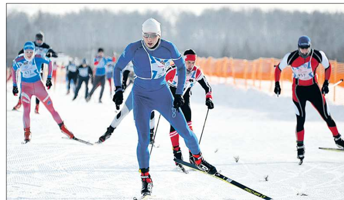
Лыжники должны выйти на старт 27 ноября. Их календарь не подвергся изменениям

Международный календарь фигурного катания тоже понёс