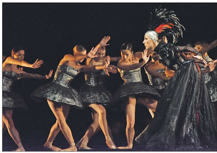
Балет «Приказ короля» номинирован на «Маску» в девяти категориях