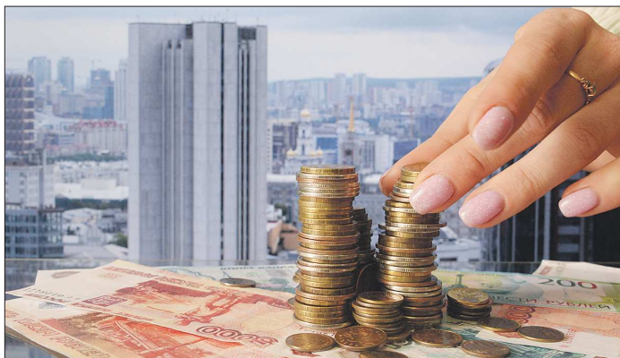
Формирование проекта бюджета области, власти рассчитывали, что восстановление экономической активности произойдёт в следующем году

Вчера правительство Свердловской области одобрило проект бюджета на 2021 год и плановый период 2022–2023 годов. Несмотря на то, что доходы сократились, урезать расходы власти не планируют.