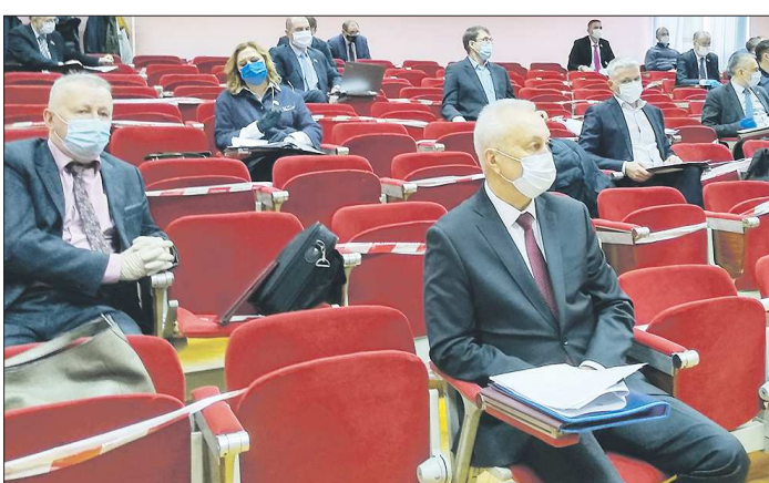
Маски, перчатки и социальная дистанция – депутаты выполняют все меры предосторожности

Сложная эпидемиологическая обстановка не остановила депутатов, ведь в повестке заседания был жизненно важный вопрос для муниципалитета – корректировка бюджета. Дополнительно из областной казны поступили 212,7 миллиона рублей. Большая часть будет потрачена на оснащение новых детсадов и прошедшей капремонт школы №85. Также предусмотрены выплаты нижнетагильским учителям за классное руководство и деньги на приобретение средств дезинфекции для учреждений образования.