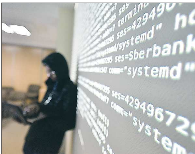
Сейчас в Свердловской области в сфере IT работают более 15 тысяч человек

Свердловская область уверенно входит в десятку регионов, где сфера информационно-коммуникационных технологий наиболее развита. Отчасти лидерские позиции объясняются тем, что в Екатеринбургe расположены офисы ряда федеральных компаний, в том числе разработчиков программного обеспечения (софта). Как сообщили в департаменте информатизации и связи Свердловской области, сейчас крупнейшими компаниями – разработчиками софта, работающими в Екатеринбурге, являются СКБ Контур, Naumen, ГК Хост, ГК Экстрим PRO, НПО «Сапфир».