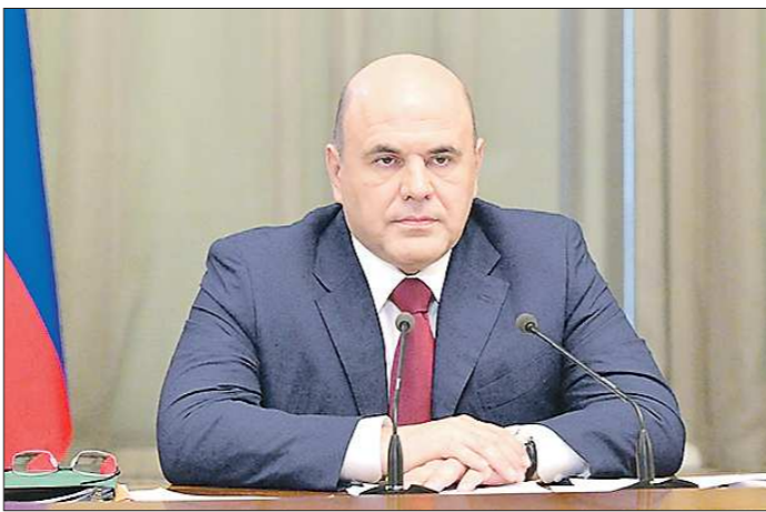
Михаил Мишустин выразил надежду, что бюджетные деньги будут использованы максимально эффективно

Несмотря на экономический кризис, отказываться от решения долгосрочных социальных проблем государство не планирует. Так, пенсия будет индексироваться выше уровня инфляции (напомним, что сейчас уровень годовой инфляции составляет 3,7 процента). Предполагается финансирование развития городской среды и сёл. Дополнительно из бюджета будут выделены деньги