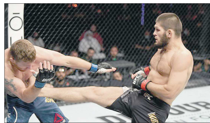
Хабиб Нурмагомедов (справа) в бою с Джастином Гэйджи доминировал и в стойке, и в партере

о том, что Гэйджи - самая серьёзная угроза в карьере Хабиба. О том, что именно Джасти сможет стать тем, кто нанесёт Нурмагомедову первое