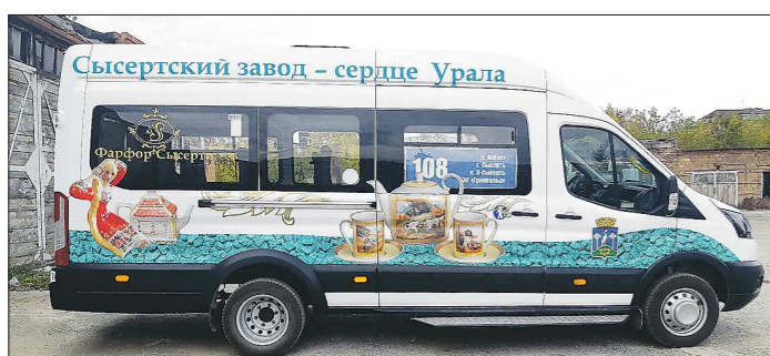
Весной администрация Сысерти объявила конкурс лучших идей стилизации новых маршрутов. Вот как выглядит один из автобусов