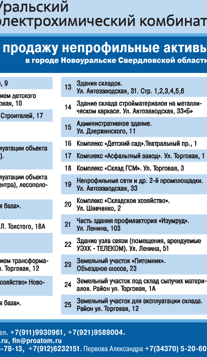
Подготовлено в соответствии с критериями, утвержденными приказом Департамента информационной политики Свердловской области от 09.01.2018 №1 «Об утверждении критериев отнесения информационных материалов, публикуемых государственными учреждениями Свердловской области, в отношении которых функции и полномочия учредителя осуществляет Департамент информационной политики Свердловской области, к социально значимой информации».