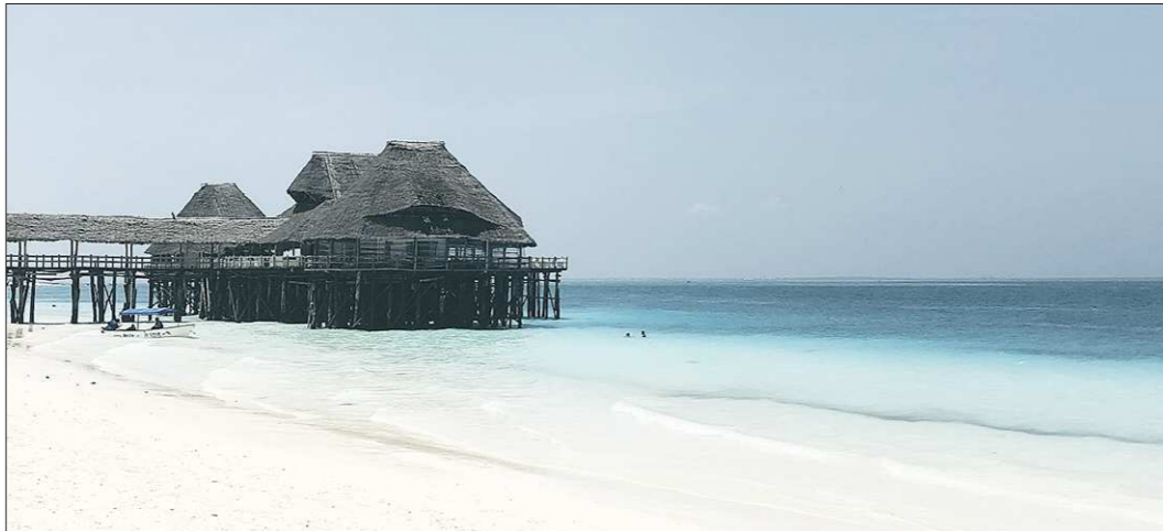
Самые лучшие пляжи на острове Занзибар - Нунгви (на фото) и Кендва

В России по-прежнему сохраняется сложная ситуация с заболеваемостью коронавирусом. При этом заместитель председателя Совета безопасности России Дмитрий Медведев признал закрытие границ с другими странами неэффективной мерой борьбы с распространением COVID-19.