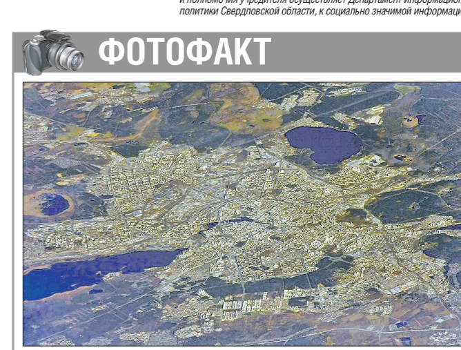
Российский космонавт Иван Вагнер поприветствовал Екатеринбург, засняв его с борта Международной космической станции.

Ирина ПОРОЗОВА Подготовлено в соответствии с критериями, утвержденными приказом Департамента информационной политики Свердловской области от 09.01.2018 №1 «Об утверждении критериев отнесения информационных материалов, публикуемых государственными учреждениями Свердловской области, в отношении которых функции и полномочия учредителя осуществляет Департамент информационной политики Свердловской области, к социально значимой информации».