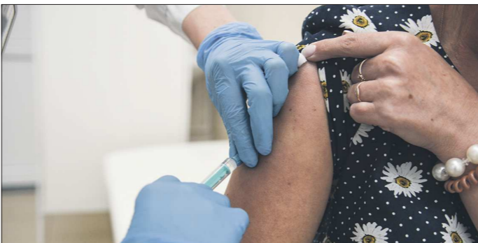
Свердловские власти рассчитывают, что до конца 2020 года в наш регион поступит 3 730 доз вакцины от COVID-19