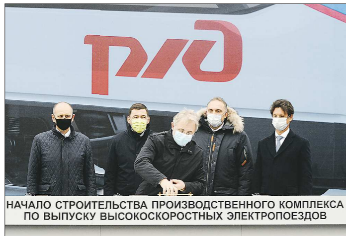
НАЧАЛО СТРОИТЕЛЬСТВА ПРОИЗВОДСТВЕННОГО КОМПЛЕКСА ПО ВЫПУСКУ ВЫСОКОСКОРОСТНЫХ ЭЛЕКТРОПОЕЗДОВ

Евгений Куйвашев назвал «Уральские локомотивы» флагманом железнодорожного машиностроения и отметил важность увеличения перечня выпускаемой ими продукции. У предприятия есть серьёзный опыт производства скоростных поездов. Многим уже полюбилась пригородная «Ласточка» – предприятие выпустило 965 вагонов для этих электропоездов. В прошлом году «Уральские локомотивы» и РЖД подписали соглашение о создании двухуровневых поездов для маршрутов межрегионального следования. От обычной «Ласточки» они будут отличаться повышенной комфортностью – более удобными сиденьями, наличием телевизоров, душа, вагона-бистро. Наладить производство скоростных поездов дальнего следования