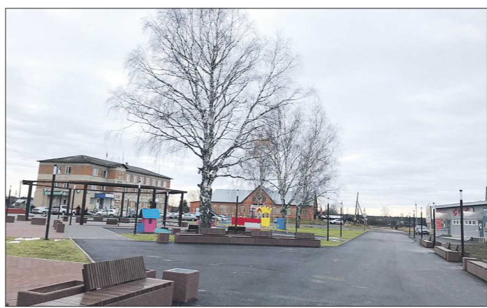
Благоустройство поселковой площади проводилось за счёт средств областного и федерального бюджетов

Подготовлено в соответствии с критериями, утвержденными приказом Департамента информационной политики Свердловской области от 09.01.2018 №1 «Об утверждении критериев отнесения информационных материалов, публикуемых государственными учреждениями Свердловской области, в отношении которых функции и полномочия учредителя осуществляет Департамент информационной политики Свердловской области, к социально значимой информации».