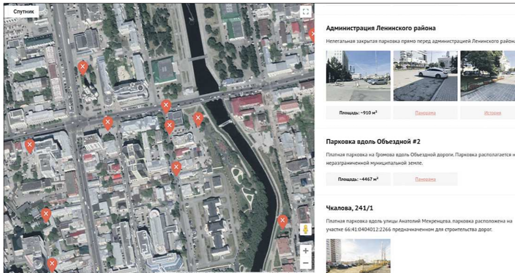
Информация о парковках обновляется и уточняется ежедневно

– В нашей команде – три человека, занимаемся проектом в свободное от основной работы время, – рассказывает Дмитрий. – Мы пишем много обращений в администрацию Екатеринбурга по поводу участков, которые видны на городских улицах. Одна из проблем – огромное количество парковок «для своих», на которые невозможно попасть обычным жителям. Площадки огорожены шлагбаумами, цепочками и заборами, и многим кажется, что это действительно частные территории. Но если посмотреть на кадастровую карту, то выясняется, что этих заборов там быть не должно: это территории общего пользования. Мы решили сгруппировать такие примеры и создать простой и понятный ресурс, который мы могли бы дополнять с участи-