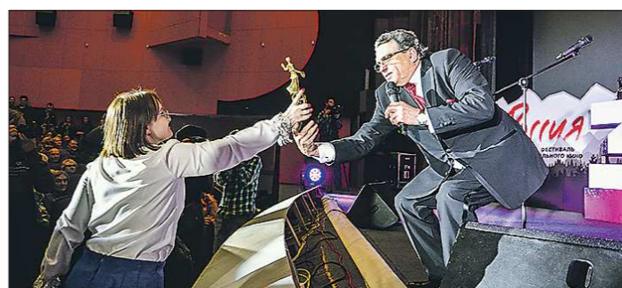
Вероятно, одной из любимых зрителями традиций фестиваля – передачи призов через зал – в этом году придётся пожертвовать

Подготовлено в соответствии с критериями, утвержденными приказом Департамента информационной политики Свердловской области от 09.01.2018 №1