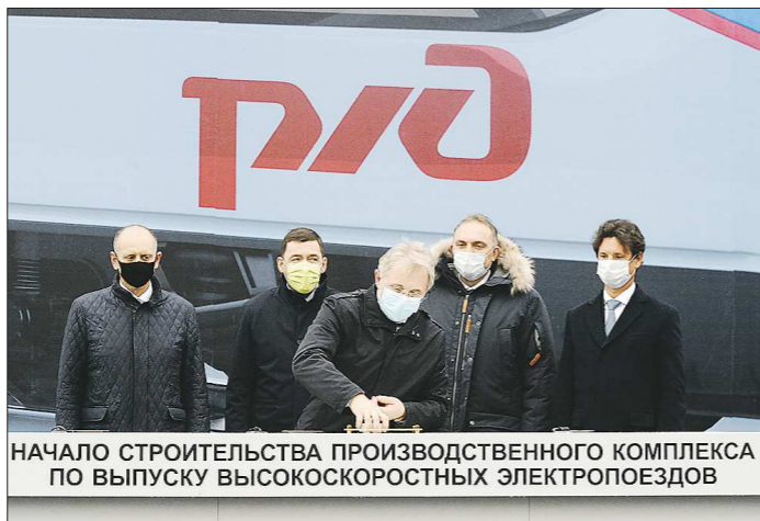
НАЧАЛО СТРОИТЕЛЬСТВА ПРОИЗВОДСТВЕННОГО КОМПЛЕКСА ПО ВЫПУСКУ ВЫСОКОСКОРОСТНЫХ ЭЛЕКТРОПОЕЗДОВ