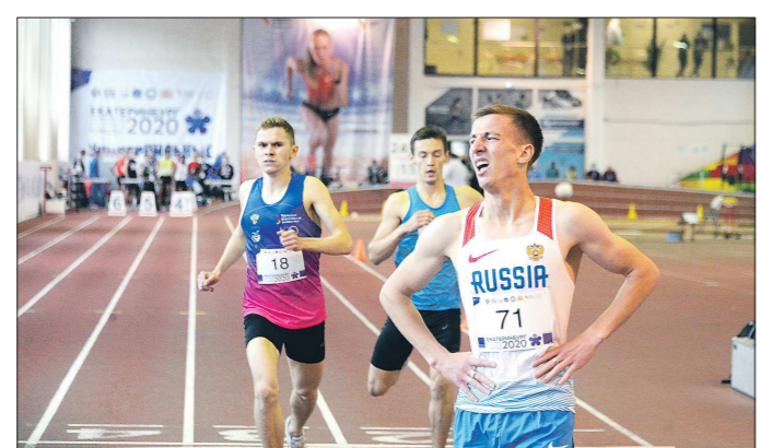
Большинство стартов VII летней Универсиады, в том числе и по лёгкой атлетике, прошли на спортивных объектах Уральского федерального университета

ДЗДО. Этот вид спорта (14 комплектов медалей) ока-