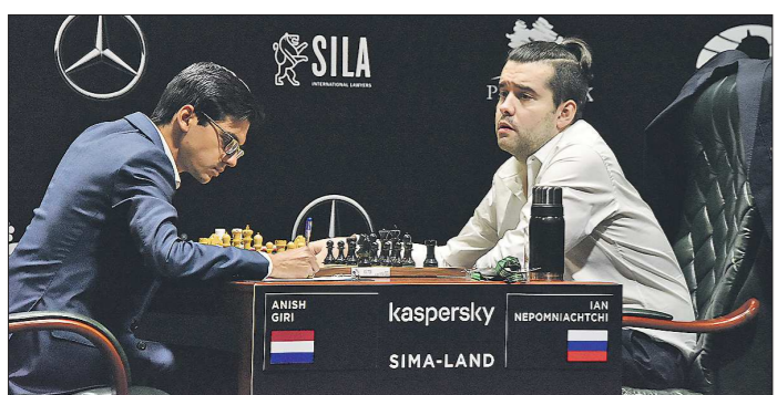
Неизвестно, когда гроссмейстеры вновь смогут сесть за шахматные доски. Но это точно произойдет уже в следующем году