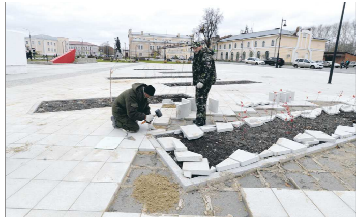
Подрядчики завершают укладку плитки на площади Ленина

Параллельно с реконструкцией памятников в Ирбите приводят в порядок дороги, благоустраивают скверы, ремонтируют учреждения соцкультбыта. Так, совсем недавно в городе заработал обновлённый стадион – с футбольным полем, спортплощадками, трибунами. Идёт капитальный ремонт дворца культуры им. В. Костевича – это самое большое учреждение культуры в Восточном управленческом округе (700 зри-