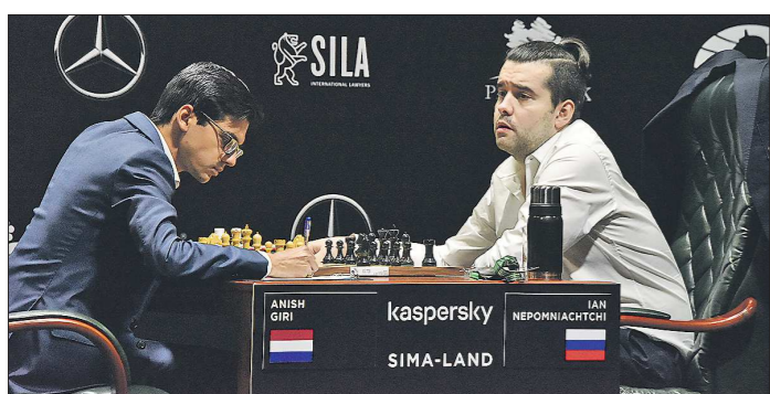
Неизвестно, когда гроссмейстеры вновь смогут сесть за шахматные доски. Но это точно произойдет уже в следующем году