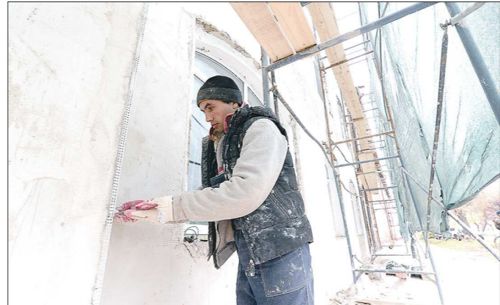
Дома «оделись» в строительные леса. На реставрацию одного дома, в среднем, уходит по 30 млн рублей

тельских мест). Кстати, на фасаде здания подрядчики сумели сохранить уникальную мозаику (её авторы – заслуженные художники страны Геннадий Мосин и Миша Брусилоский).