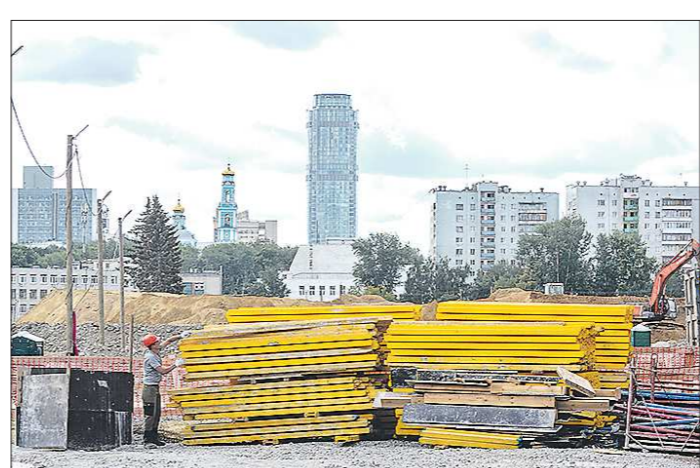
Власти считают, что увеличение объёмов застройки города не должно происходить в ущерб комфорту граждан

В тот же день власти Азербайджана сообщили, что в результате ракетных обстрелов со стороны армянских войск погибли 60 и получили ранения более 270 мирных жителей