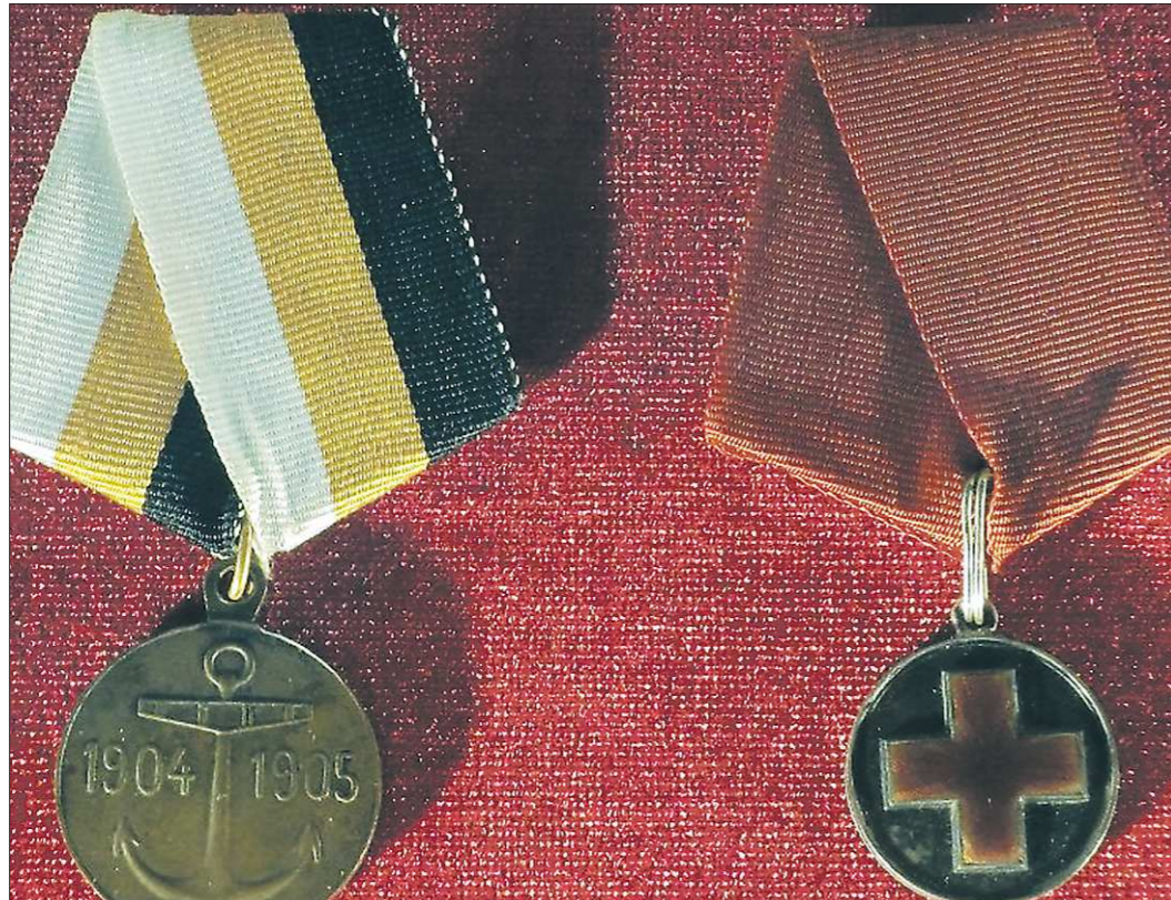
В память о Русско-японской войне было учреждено несколько наград. В частности, медаль за поход 2-й Тихоокеанской эскадры (слева) и медаль Красного Креста за Русско-японскую войну (справа)