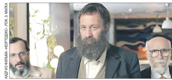
Вход на показы фестиваля бесплатный, но предварительно нужно пройти регистрацию на сайте

Подготовлено в соответствии с критериями, утвержденными приказом Департамента информационной политики Свердловской области от 09.01.2018 №1