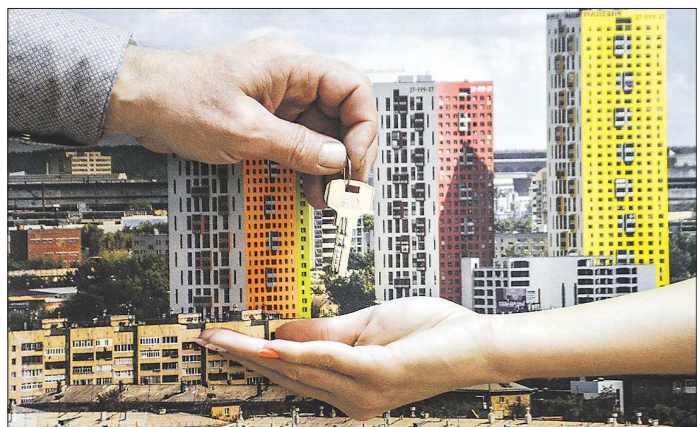
Возможность приобрести жильё в новостройке в ипотеку по сниженной ставке появилась у россиян в конце апреля