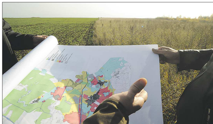
Цену земли региона максимально приблизили к рыночной

Министерством по управлению государственным имуществом Свердловской области (МУГИСО) утверждена кадастровая стоимость расположенных на территории региона земельных участков. Приказ опубликован на сайте министерства mugiso.midural.ru – там же перечень из более чем 1,3 млн земельных участков, по кадастровому номеру которых можно узнать и их кадастровую стоимость. Ожидается, что в ближайшее время документ будет опубликован на pravo.gov66.ru .