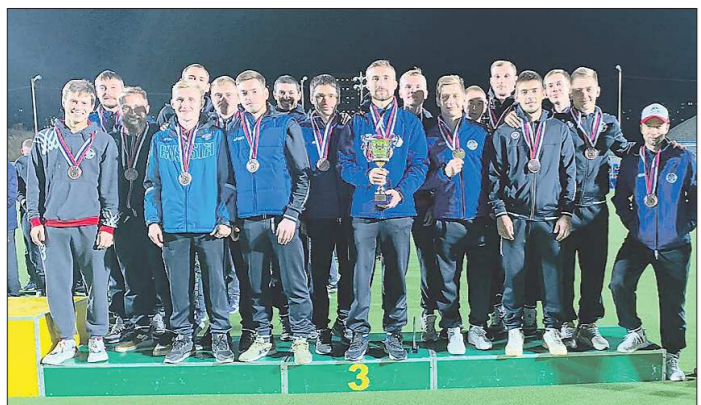
«Динамо-Строитель» на пьедестале почёта в Казани с наградами за третье место в чемпионате России