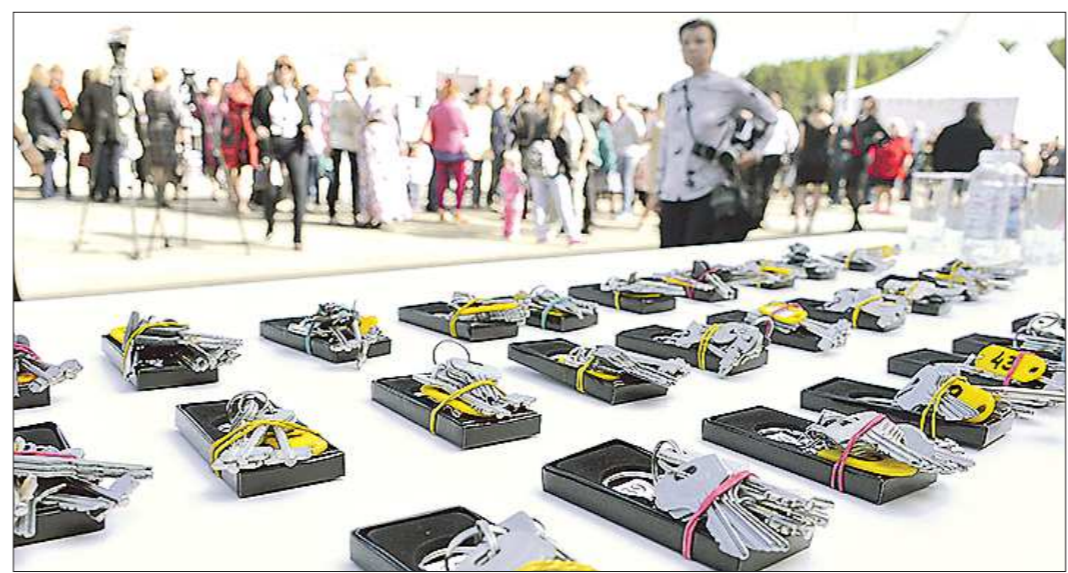
Всего в Новолялинском ГО в этом году новоселье отметят 190 жителей