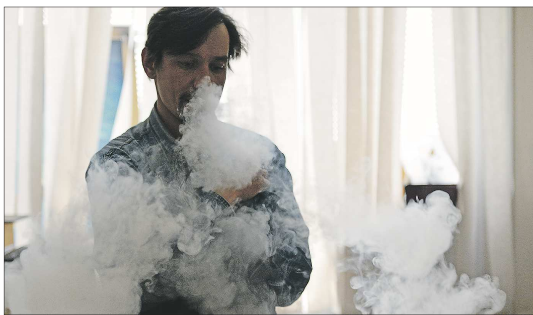
Штрафы за курение вейпов и кальянов в общественных местах уже сейчас аналогичны штрафам за курение обычных сигарет – до 1500 рублей

БЛАГОТВОРИТЕЛЬНОСТЬ СТАНЕТ ПРОЗРАЧНОЙ. С 5 октября устанавливаются новые правила для сбора благотворительных пожертвований. Соответствующие поправки в закон о благотворительной деятельности и добровольчестве призваны повысить прозрачность сборов через ящики-копилки