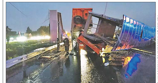
Разрушенный надземный переход сейчас закрыт для пешеходов

В Свердловской области ликвидированы последствия обрушения моста на федеральной трассе М-5 «Урал».