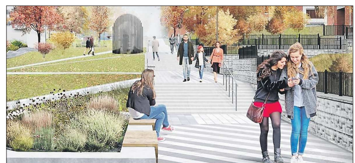
Таким бульвар станет уже в ближайшие 2–3 года