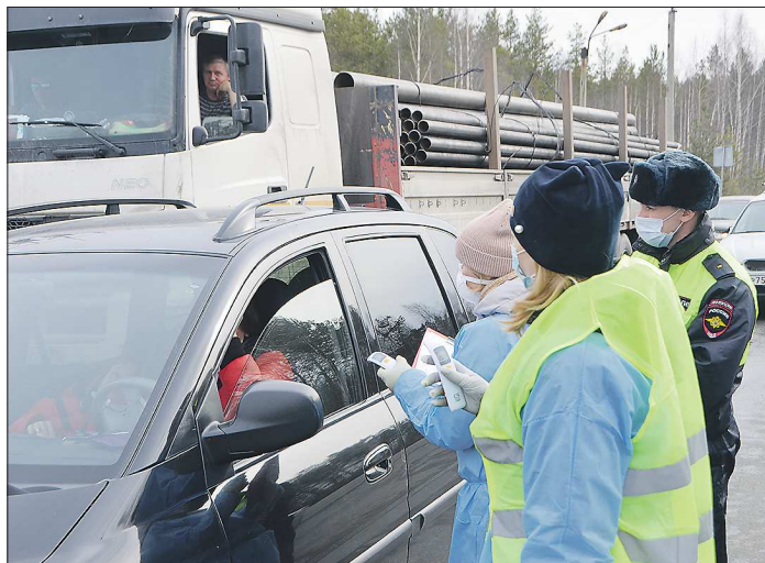
На въезде в Серов круглосуточно работает стоп-контроль: все, кто въезжает в город, проходит регистрацию, контроль температуры и получают памятку по профилактике коронавируса

– Уважаемые граждане, пожалуйста, оставайтесь дома. Соблюдайте требования социального дистанцирования! Общественные места закрывают сигнальными лентами. Так, в Берёзовском опечатали парк Победы, исторический сквер и тропу здоровья, детские и спортивные площад-