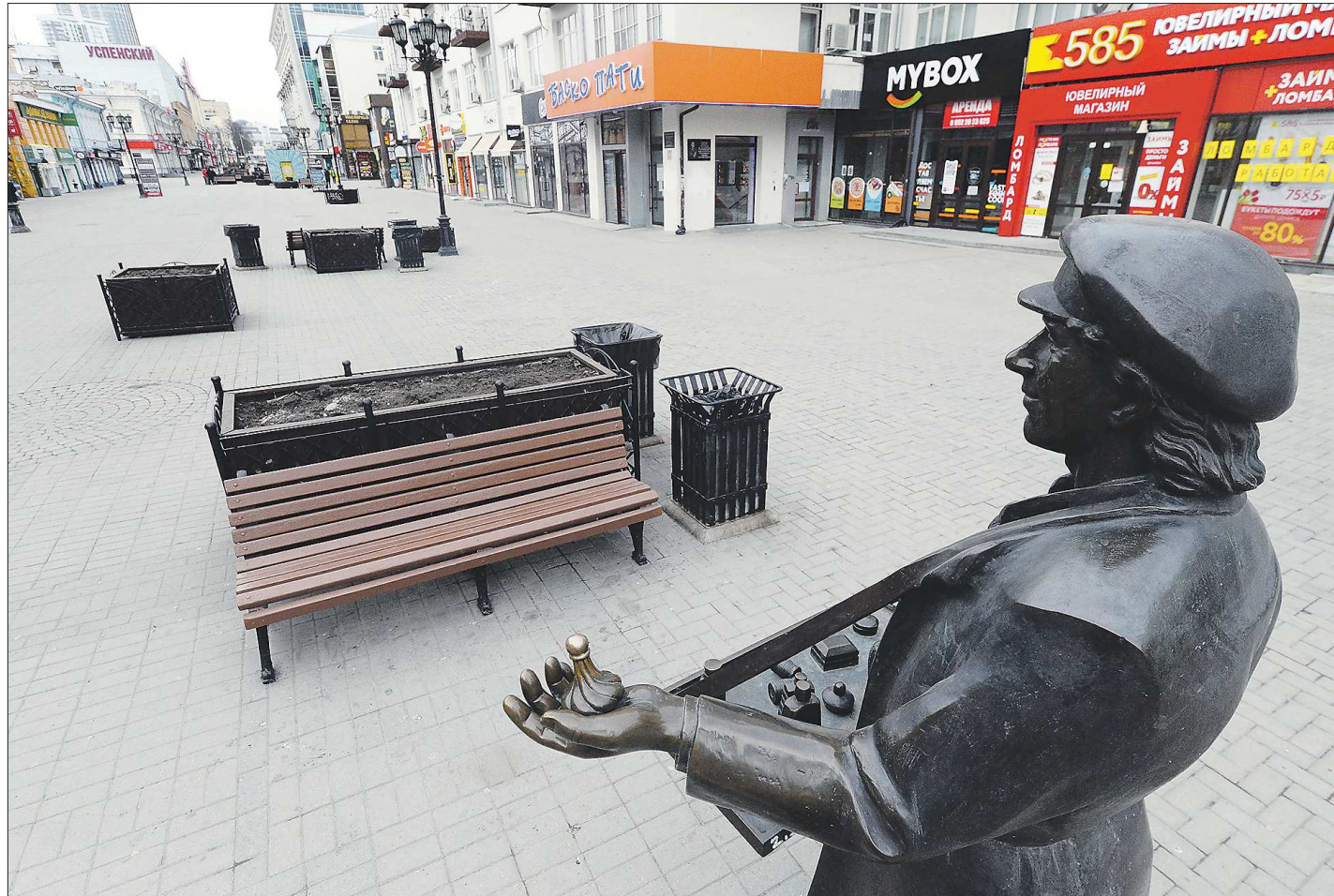
Пешеходный Арбат Екатеринбурга, улица Вайнера, всегда многолюдная, в эти дни практически опустела. Это значит, что в большинстве своём жители столицы Урала стараются соблюдать режим самоизоляции

ДВОЕ В АВТО И ПОЛТОРА МЕТРА ДИСТАНЦИИ. Указ «О введении на территории Свердловской области режима повышенной готовности и принятии дополнительных мер по защите населения от новой коронавирусной инфекции» опубликован в «ОГ» за 19 марта, и 18 марта – на официальном интернет-портале правовой информации Свердловской области www.pravo.gov66.ru . Уже первым пунктом в нём предписывалось «Вести на территории Свердловской области режим повышенной готовности» для органов управления и структур по предупреждению и ликвидации чрезвычайных ситуаций. А далее большая часть пунктов касалась непосредственно граждан. Например, на период с 18 марта по 12 апреля ограничивались деловые, спортивные, культурные, развлекательные мероприятия с участием более 50 человек. Всё это стало неактуальным 30 марта, когда новым указом были при-