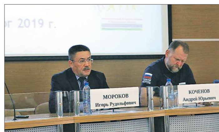
Фото 6. Региональный форум отцов

Уполномоченный при Президенте РФ по правам ребёнка Анна Кузнецова в процессе обсуждения темы питания в системе образования подчеркнула значимость общественного, родительского контроля за его качеством.