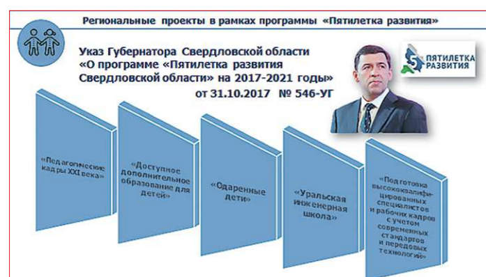
Фото 3. Пятилетка развития

В системе стратегических документов, затрагивающих широкий круг вопросов, направленных на совершенствование государственной политики в сфере защиты детства, в законодательстве Российской Федерации и законодательстве Свердловской области отсутствует нормативно закреплённое понятие «комплексная безопасность детей».