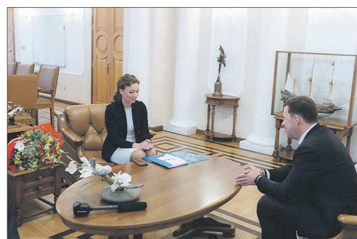
Фото 4. Встреча А.Ю.Кузнецовой с Е.В. Куйвашевым

К подготовке форума были привлечены все профильные ведомства: Аппарат Уполномоченного по правам ребёнка в Свердловской области, региональные министерства социальной политики, спорта, образования и другие, а также ряд общественных организаций (в частности, оператором форума выступил «Российский детский фонд»). Участие в форуме приняла Уполномоченный при Президенте РФ по правам ребёнка Анна Кузнецова.