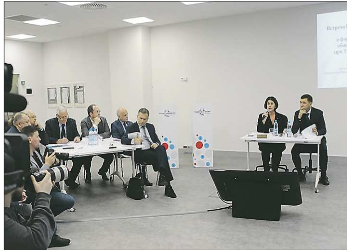
Встреча Губернатора Свердловской области с предпринимателями в формате расширенного заседания общественного экспертного совета при Уполномоченном (28 ноября, г. Екатеринбург)

Очередной прямой диалог Главы региона с собственниками и руководителями субъектов малого и среднего предпринимательства состоялся 28 ноября в «Точке кипения — Екатеринбург». В этот раз встреча прошла в формате расширенного заседания общественного экспертного совета при Уполномоченном впервые с участием Губернатора Свердловской области Е.В. Куйвашева.