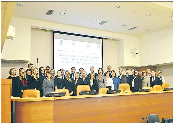
Уполномоченные и сотрудники Аппаратов Уполномоченных в Арбитражном суде Свердловской области (16 октября, г. Екатеринбург)

— в рамках дискуссионных площадок «Развитие институтов внесудебного урегулирования конфликтов в предпринимательской сфере» и «Проблемы защиты субъектов предпринимательской деятельности и их риски при «конкуренции норм» в экономической сфере» (Арбитражный суд Свердловской области, 16 октября, г. Екатеринбург).