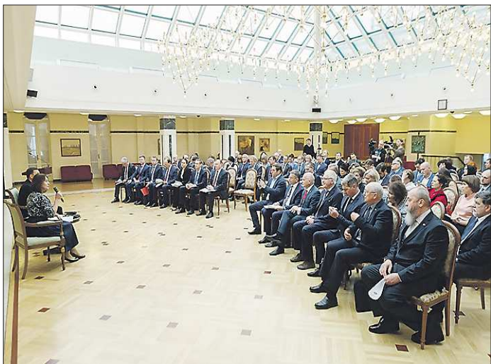
Встреча Губернатора Свердловской области с собственниками и руководителями субъектов малого и среднего предпринимательства (17 мая, г. Екатеринбург)

Вопросы и предложения касались развития промышленных парков, противодействия обороту контрафактной продукции, развития транспортной инфраструктуры, возможных рисков из-за роста стоимости потребления электрической энергии в связи с изменением порядка расчета сбытовых надбавок, сложностей при согласовании контейнерных площадок для обеспечения возможности учета по фактическому накоплению твердых коммунальных отходов, затруднений пассажирских перевозчиков при получении мер государственной поддержки на приобретение новых автотранспортных средств и других сфер.