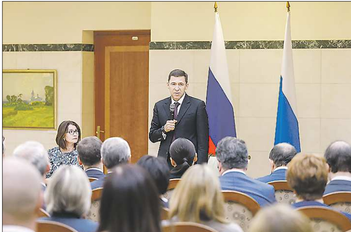
Встреча Губернатора Свердловской области с собственниками и руководителями субъектов малого и среднего предпринимательства (17 мая, г. Екатеринбург)

17 мая состоялась встреча 51 Губернатора Свердловской области Е.В. Куйвашева с собственниками и руководителями субъектов малого и среднего предпринимательства.