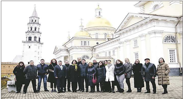
Посещение Наклонной башни Демидовых Невьянского государственного историко-архитектурного музея (15 октября, г. Невьянск)

Традиционно региональные уполномоченные и представители их аппаратов принимают активное участие в мероприятиях Международного форума «Юридическая неделя на Урале». XI Международный форум прошел в г. Екатеринбурге с 14 по 18 октября. В мероприятиях Уполномоченного приняли