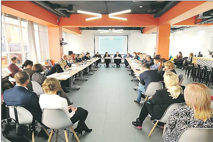
Круглый стол «Об актуальных направлениях улучшения условий ведения бизнеса» (15 октября, г. Нижний Тагил)

— в ходе круглого стола об актуальных направлениях улучшения условий ведения бизнеса (центр «Мой бизнес», 15 октября, г. Нижний Тагил);