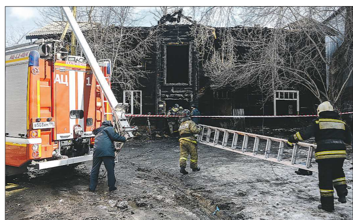
Когда приехал журналист «ОГ», пожарные доставали лестницу, по которой собирались подняться на второй этаж

По улице Омской, возле Центра развития ребёнка детского сада №104, всё ещё стоит сильный запах гари. Местные жители до сих пор не могут оправиться от произошедшего. Здесь поздно вечером 26 марта загорелся деревянный двухэтажный дом. Пожар унёс жизни 7 человек, ещё одна женщина позже скончалась в больнице. «ОГ» приехала на место сразу после трагедии. Там работали сотрудники МЧС и Следственного комитета — более десятка человек.