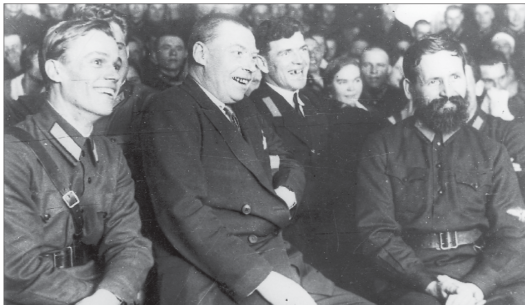
Первый секретарь Свердловского обкома ВКП(б) Иван Кабаков (в центре) на концерте самодеятельности в аэроклубе. 1935 г.