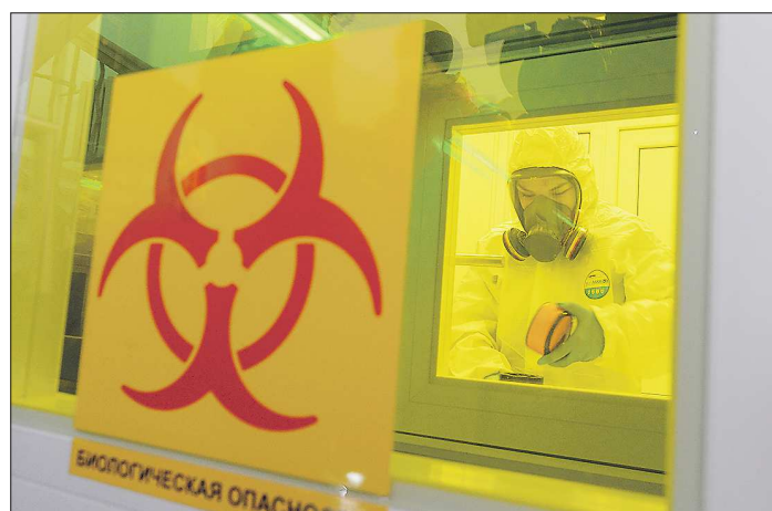
Исследование проб на коронавирус в лаборатории проводят с помощью набора реагентов, разработанного Центром вирусологии и биотехнологии «Вектор» в Новосибирске

– Наша задача – качественно и быстро выполнить тест на коронавирусную инфекцию, на это уходит шесть ча-