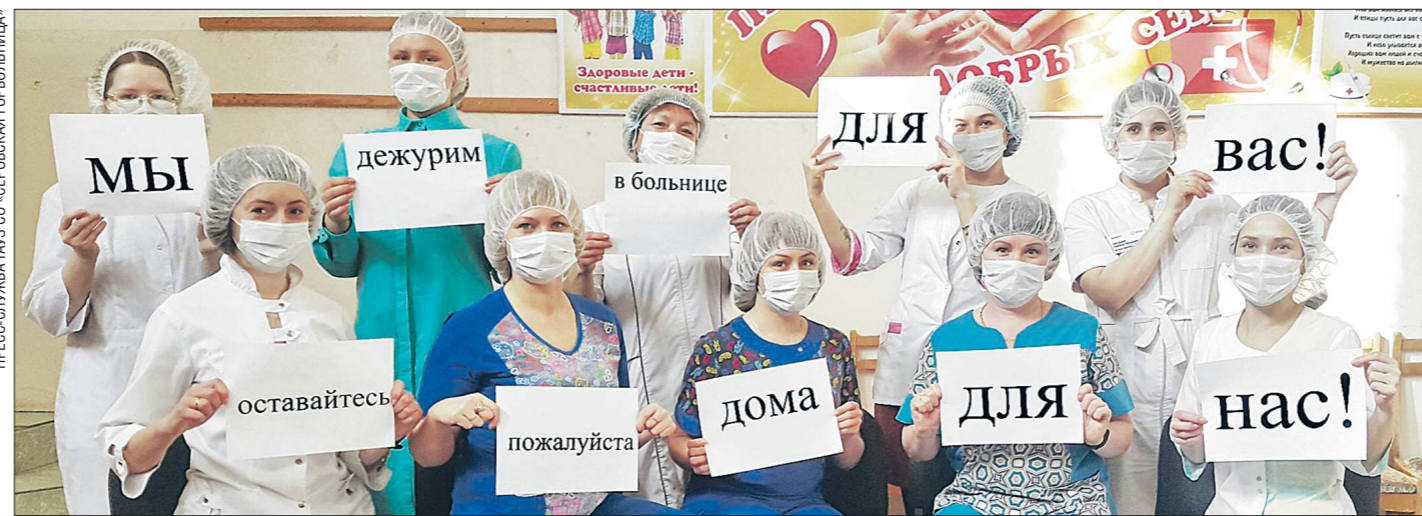
Работники Серовской городской больницы поддержали акцию «Останьтесь дома ради нас!»