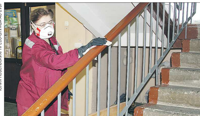
На СУБРе в Североуральске регулярно проводят дезинфекцию, а показания термометра служат пропуском на работу

Распространение коронавируса всё больше сказывается на повседневной жизни уральцев. Предприятия и различные организации вводят дополнительные меры безопасности, школы и вузы переходят на дистанционное обучение. И если в Екатеринбурге уже начинают привыкать к жизни по новым правилам, то что происходит в муниципалитетах региона?