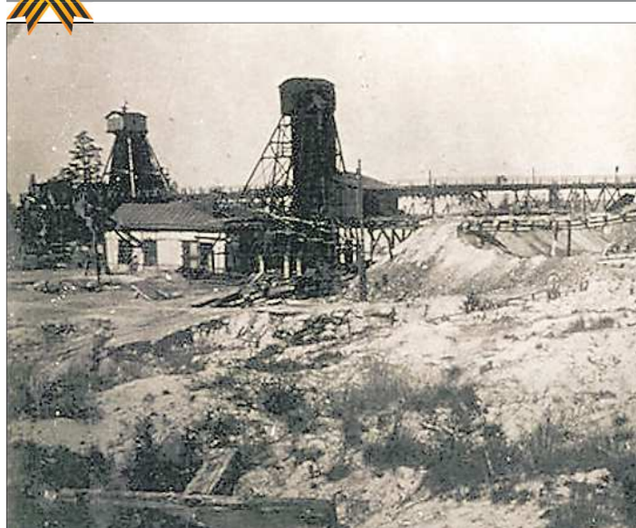
В 30-е годы прошлого столетия в Нижнем Тагиле построены медные шахты