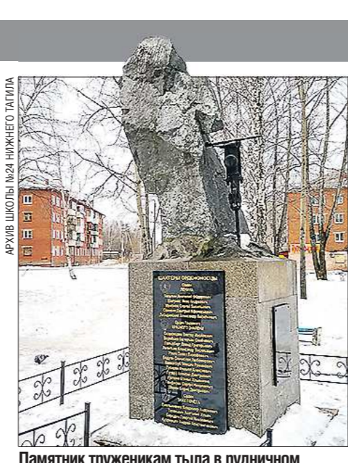
Памятник труженикам тыла в рудничном посёлке установлен на частные пожертвования