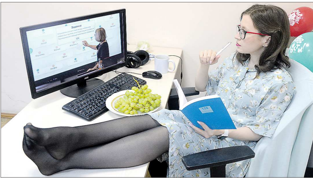
Возле зданий вузов стало непривычно пусто: студенты осваивают дисциплины не выходя из дома

В прошлом номере «Областная газета» рассказывала о том, что в связи с неблагоприятной ситуацией по коронавирусу школьники до 12 апреля будут учиться дистанционно. Студенческую братию временные ограничения тоже не обошли стороной: ребята теперь будут слушать лекции и выступать на семинарах, не выходя за порог дома.