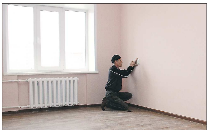
В секции закончили чистовую отделку. Осталось только закупить мебель

Дни открытых дверей в вузах тоже перешли в сеть. Например, институты УрФУ представляют образовательные программы в формате ток-шоу: трансляции пройдут в сообществе для абитуриентов во «ВКонтакте».