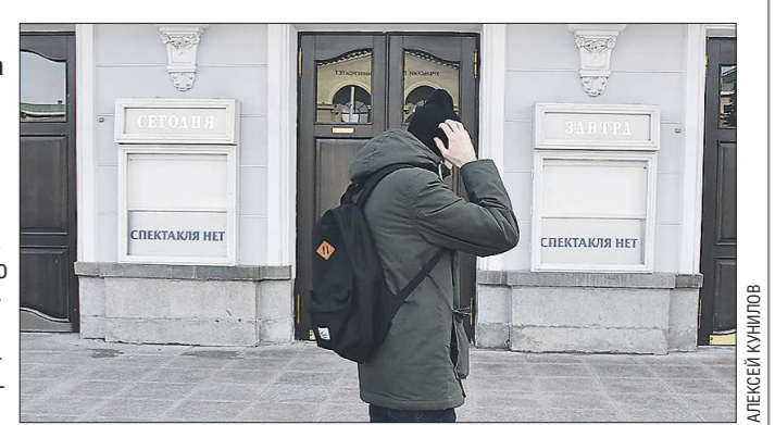
Подробнее о ситуации с закрытием культурных учреждений – на oblgazeta.ru