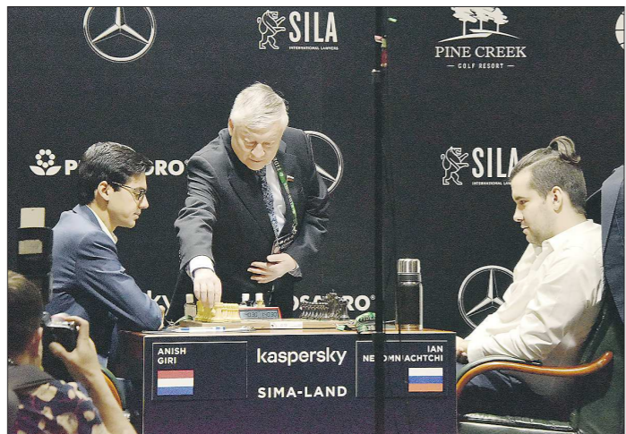
Анатолий Карпов сделал символический ход в партии Гири (слева) – Непомнящий

Во вторник в столице Урала сыграл первый тур турнира претендентов по шахматам. Две партии закончились победой, в том числе почти за шесть часов россиянин Ян Непомнящий выиграл чёрным цветом у Аниша Гири. За партиями следил и корреспондент «Обл-газеты».