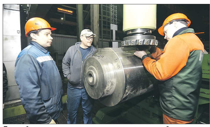
Для работы на этом станке операторы проходят обучение в Перми и в технопарке «Университетский» в Екатеринбурге. Ликбез на предприятии проводят специалисты из Германии

2012 году, появилось новое оборудование. Грузоподъемность установленного станка составляет 650 тонн. Он может обрабатывать валки с точностью до 5 микрон (тысячных миллиметра). Раньше он использовался на Уральском трубном заводе, но силами специалистов из Германии был модернизирован специально для Кушвинского завода прокатных валков. Работы велись около полугода. Запуск производства усилил компетенции области на рынке металлургического оборудования страны и мира, а также обеспечит нашу с вами экономическую безопасность. До сих пор все крупнотоннажные валки закупались за рубежом. Благодаря системной работе по техническому перевооружению предприя-